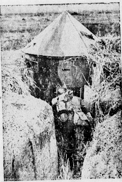
Elfoglalt orosz bunker.

— MEGHÍVÓ. A Szentesi Önkéntes Tűzoltó Testület január 4-én este 6 órai kezdettel a Szentesi Kiséri Polgári Olvasókör összes termeiben jótékonycélú tűzoltó-bálat rendez. Ezen nemes célú bála Szentes város fiatal-ságát szeretettel hívja meg a Rendezőség. Minden résztvevő ajándékot kap. A zenét Szűcs János zenekara szolgáltatja. Belépődíj 1 pengő. Kezdeté este 6 órakor. Jöjjön el mindenki! Felülfizetéseket köszönettel fogad és hírlapilag nyugtázza a Testület. 3122 — JANUÁR 4-ÉN TŰZOLTÓ-BÁL! 9081 — Levente-bál. — A nagyhegyi leventék 1942. évi január 4-én, vasárnap este 6 órai kezdettel az Ipartestület nagytermében táncmulatságot rendeznek. A nagyszerűnek ígérkező táncmulatságon a zenét a Balogh-testvérek zenekara szolgáltatja. Az est tiszta jövedelme fronton küzdő katonáink javára lesz fordítva.