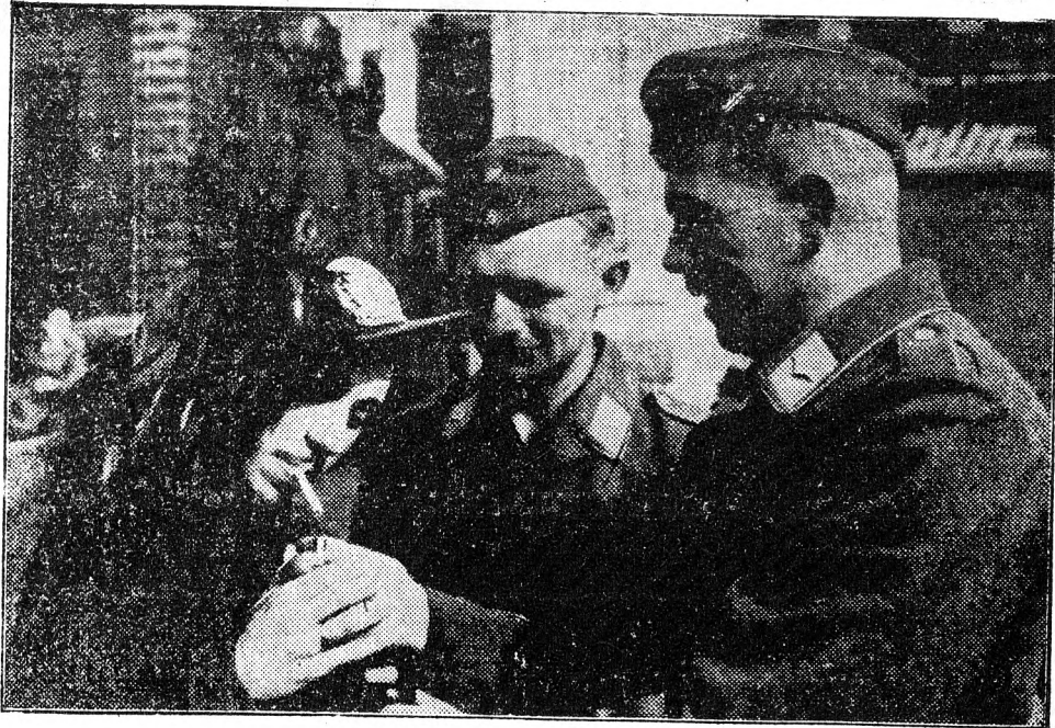
olasz bersagliere-bajtársát egy Itáliába helyezett német katona