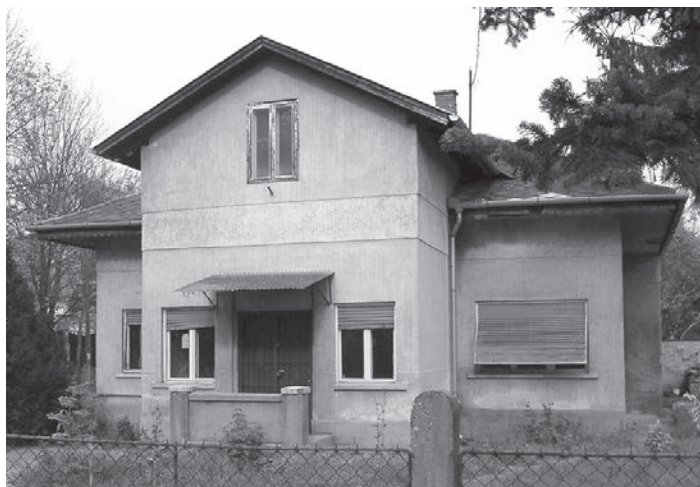
A Balló villa telkén álló épületet 2015-ben bontották le