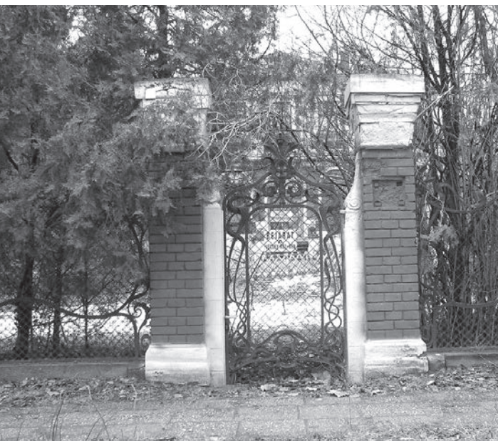
A Neruda-Illick villa kapuja