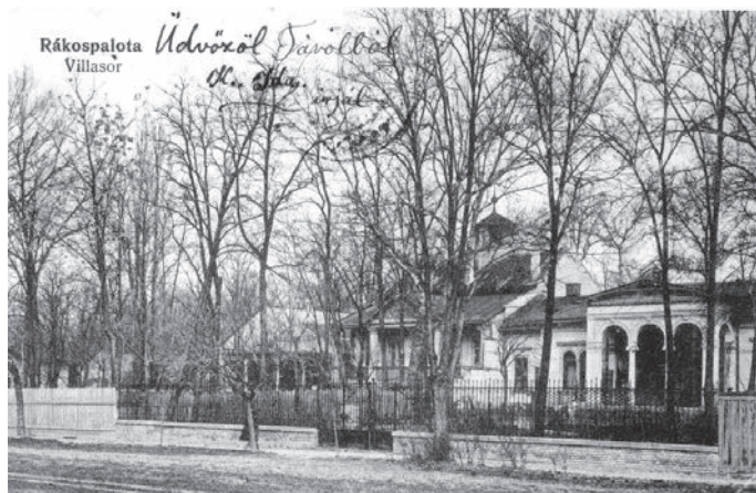
A Varga-villa, ami ma is áll szépen felújítva, és évtizedek óta óvodaként működik