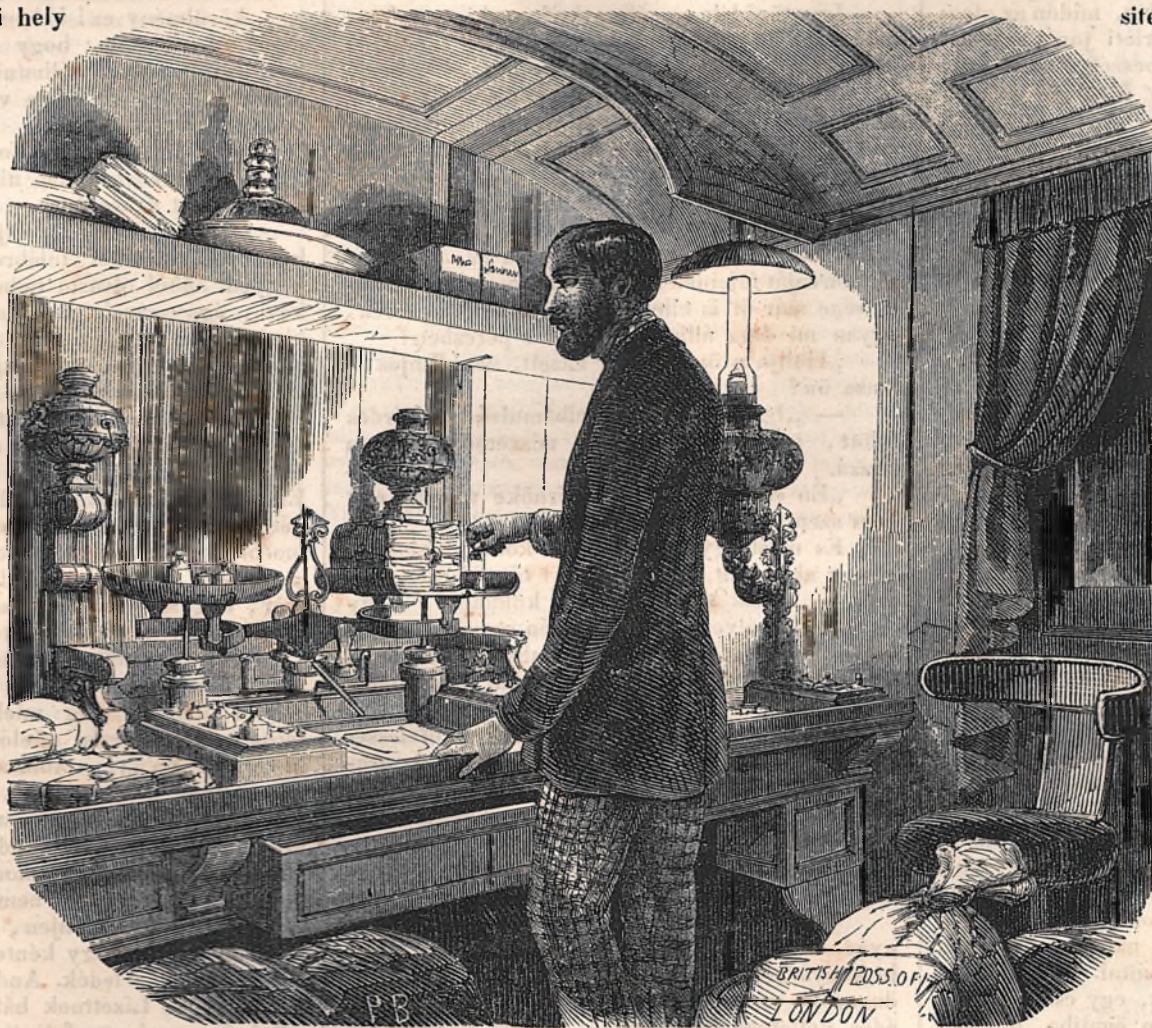
Az angol levelezés mérlegezése.