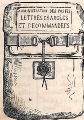
Az ajánlott és terhelt levelek tárczája.