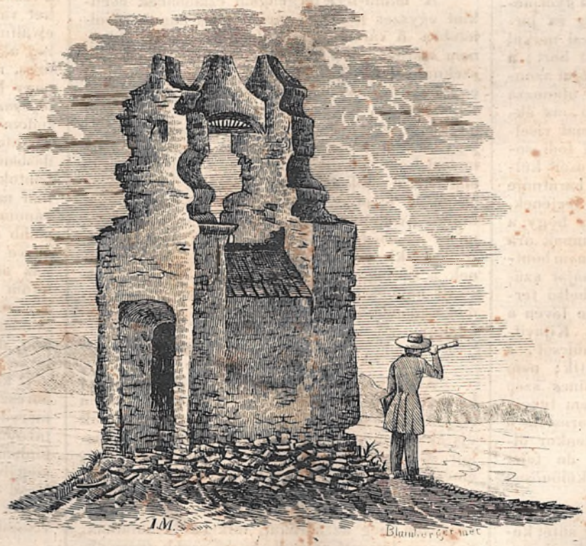
Kinizsy és Báthory diadalemléke.

Már észreuvé valahára Oldoacre hogy nagy bakot lött. Adrienne igen megindult már az utolsó szavakra; homloka hirtelen elkomorodott