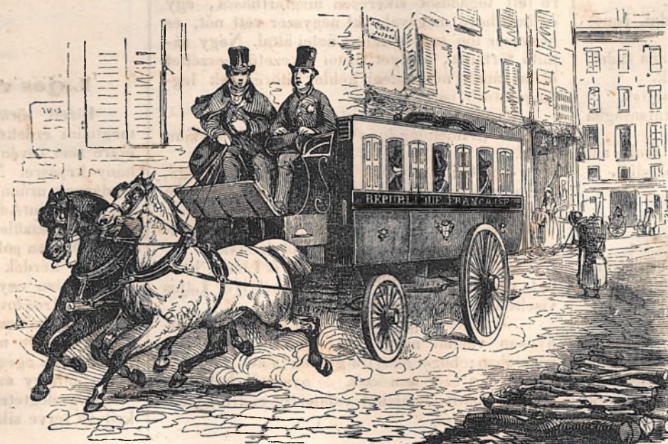
Egy omnibusz a párisi levelek kiosztására alkalmazva

legkisebb minta szerint készítvék még pedig oly pontosan, hogy a kocszi mozgása daczára is igen jól meghatározható a súly.