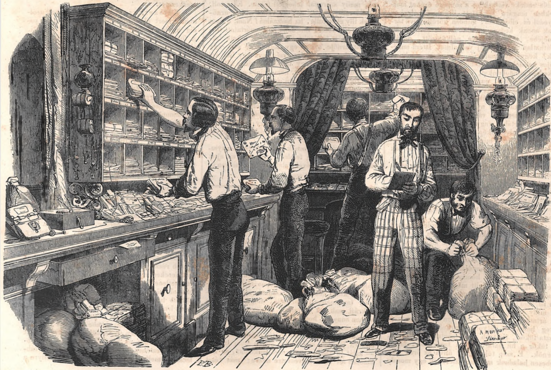
Posta kezelés. A mozdony-iroda belseje.

A fűtő gépezettel egy oldalon, de a szekrények fölött majdnem az iv alaku fődélnél van az idő mérő alkalmazva, melly szintén fontos szerepet visel, ez fa burkolatba van elhelyezve. Ez azon szer mellynek segelmével készülhet is-