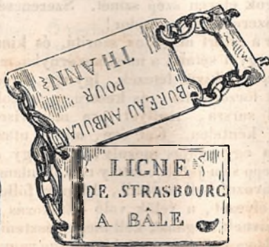
A sürgöny táskák zára.