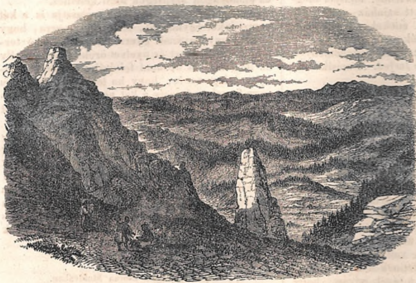
Panaşia, a moldvai Kárátok legmagasb csúcsa.