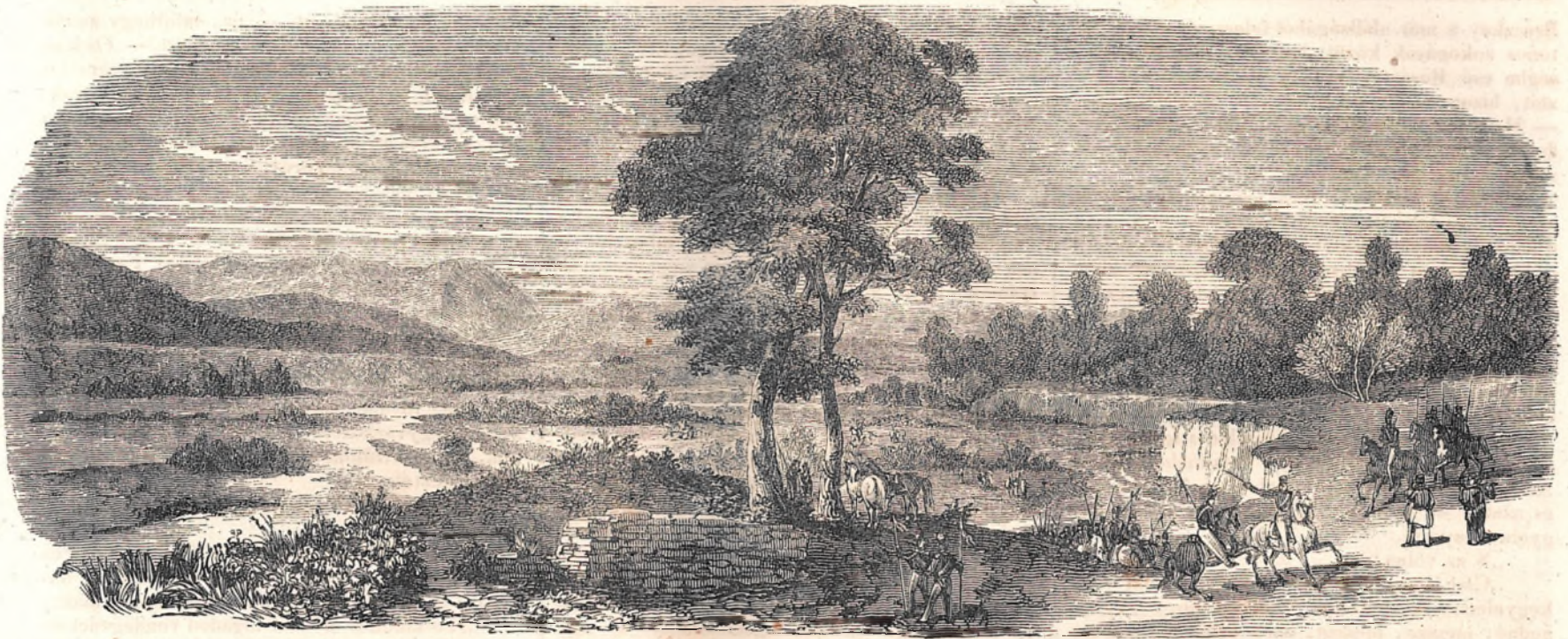
Prút part, közel Jasszyhoz.

a rablókat jól mulattatta; azonban gyakran oly erős hangokat idézván elő, hogy az általa kiállított és hátramaradt alattomos öröknek mulhatlanul halálaniok kellett.