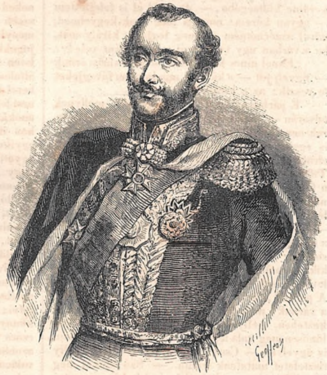
Ghyka Sándor hg. Oláhbon fejedelme. (Újabb szerű ölöny.)