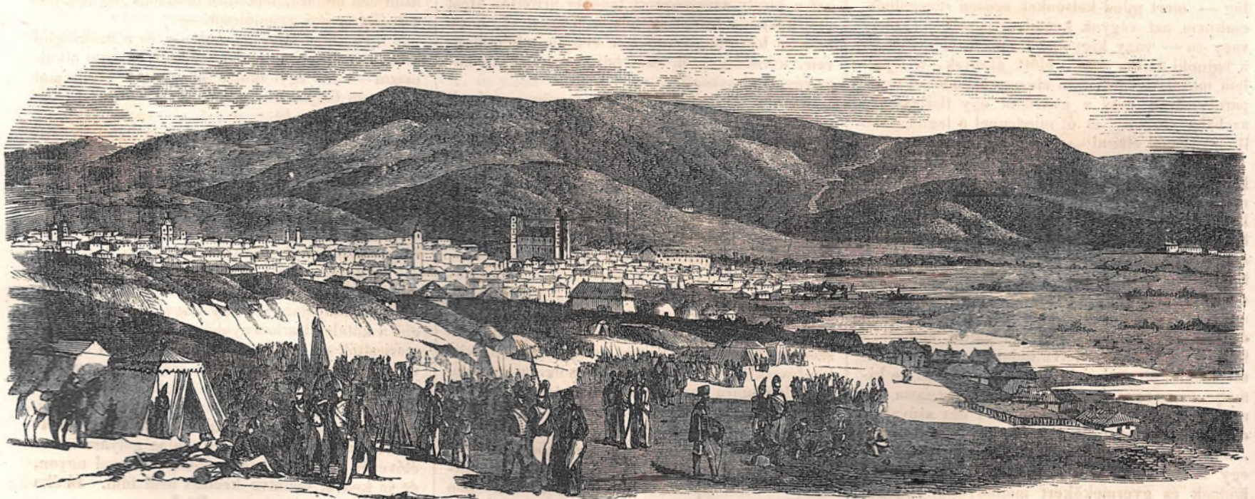
Jasszy Moldva fővárosa.