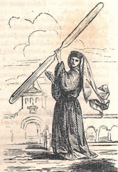
Egy szerzetesnő Moldvából.