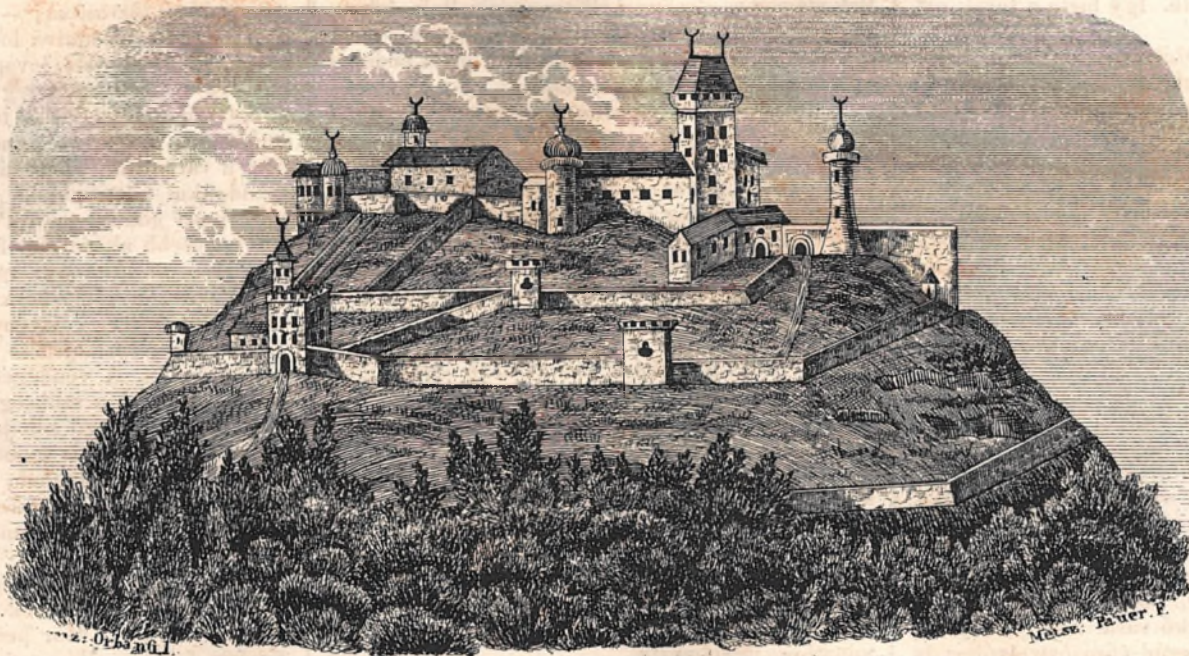
Nógrád vára a Törökök idejében.

Visszaemlé-kezés! — Te ragyogó csillag a multnak sötét jeleneteinek, u-tánnad lépelek én most, midőn honom egy ős roma Nógrád várá-nak viszonyait el-beszélni akarom. Vezérelj, és vi-lágítsd meg a rom-ok rejtékeit.