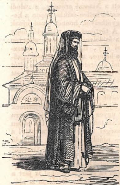
Egy moldvai szerzetes.