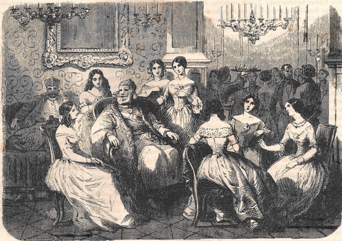
Egy estély az uralkodó hercegnél.

és noha a rabló, Endrét testének alkotásában sokkal meghaladta — mind a mellett, a mi ennek testi erejéből hibázott ügyességgel pótolta ki; minden vést okozható erős csapásait ellenének meglepő könnyűséggel tudta elkerülni, kardját pedig oly ügyesen forgatta, hogy ellenének mellvasát tartó kapesai, egymás után kezdének lepatogni. — A rabló most egy dühös vágással akart véget vetni az iszonyu tusának, e végből kardját két kezébe fogván, roppant erővel vágott Endréhez — ennek azonban ügyes, és sebes fordulása által elvesztette a rabló az egyensúlyt, és mi előtt azt ismét vissza nyerhette volna, Endre vilám sebességgel átka-