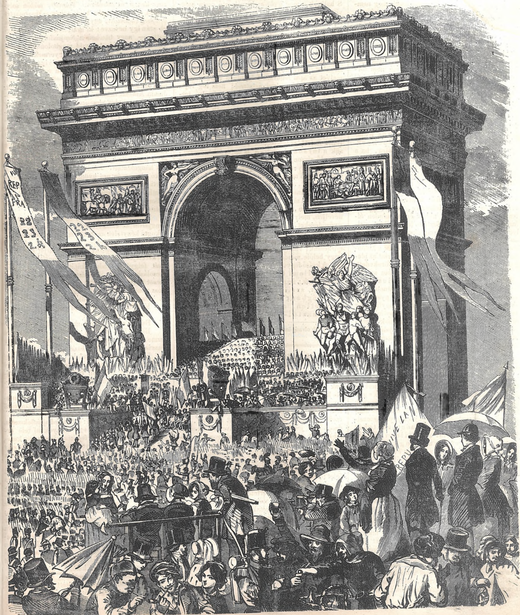
Az ideigleni kormány előtti elléptetés.

viseltetett irántok, (mit főleg a XVI. t. cikk 2 §. e) pontja azon szavai tanúsítanak „a kapcsolt részekben saját szabályuk következtében is, anyai nyelvöket használhatják, — mint-ha az országgyűlés az ő municipalis szabályuknak alárendelve volna! —) s ők mégis lázonganak. A szerbek ki akarják a németeket és magyarokat irtani s háborút kezdtek. Stur nem akar magyar lenni s izgatja a felvidéki szlávokat. Ki nem lát abban veszélyt, ki nem retteg hazánk sorsa felett, ha a hazánkban mutatkozó szláv mozgalmakat viszonyba hozza a cseh moz-