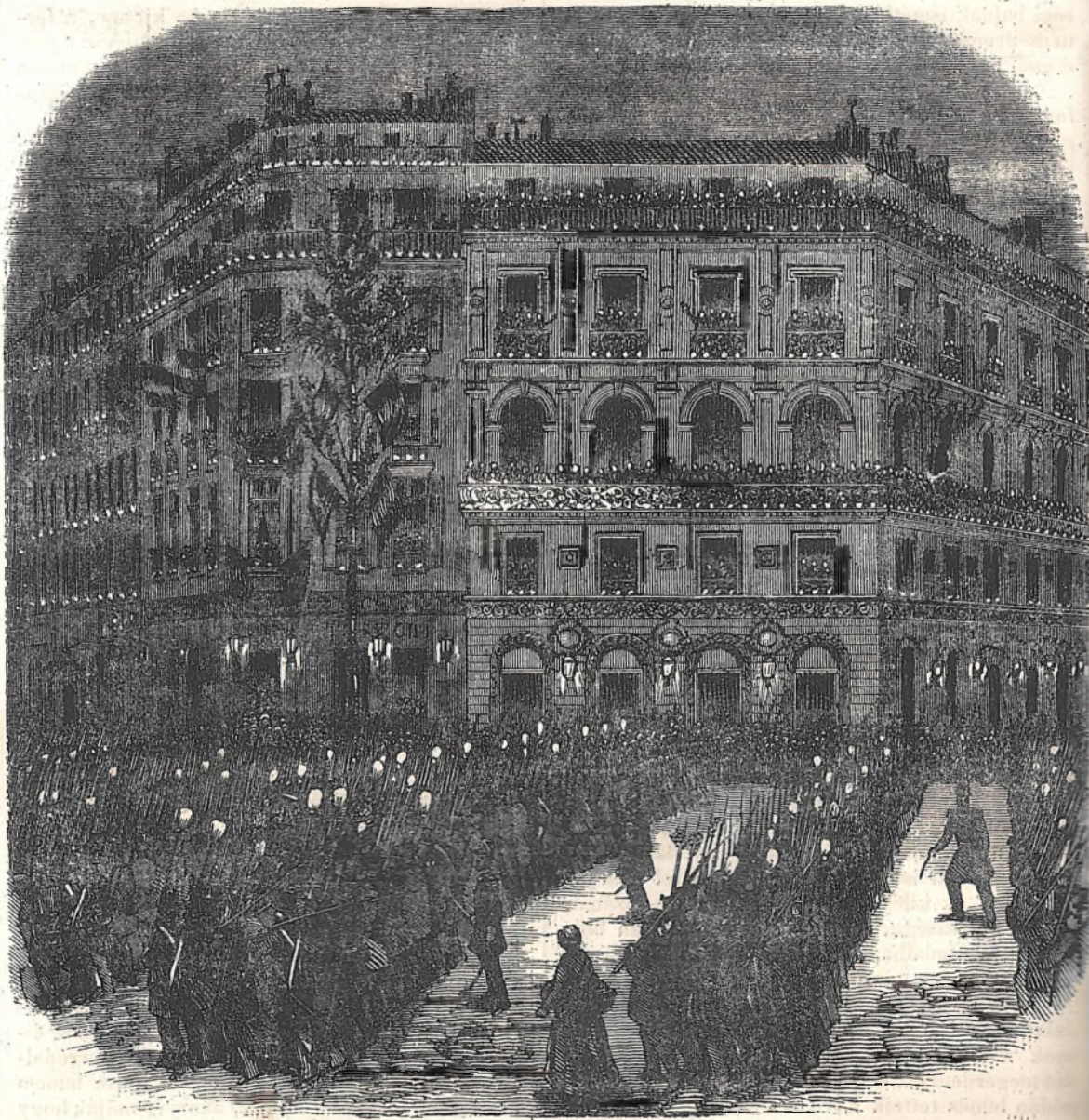
Visszajövetel a bulvárokra (boulevards).

védelmét feltalálni. — Nem clubbok, nem politikai izgatók, kik a visszavonás, gyanúsítgatás maszlagát hinthetnék el az ujdon alakult francia köztársaság elemei közé, — hanem a testvérült józan polgárok szívében fogja feltalálni legnagyobb biztositékát; — 400,000 fegyveres polgár „Eljen“ kiáltásaf üdvözlötték az ideigl. kormány tagjait. Ez hatalmas egy bizalmi szavazat, mely