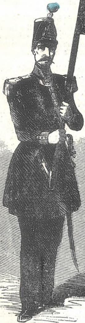
Uj zászlója a köztársaságnak.

védelmét feltalálni. — Nem clubbok, nem politikai izgatók, kik a visszavonás, gyanúsítgatás maszlagát hinthetnék el az ujdon alakult francia köztársaság elemei közé, — hanem a testvérült józan polgárok szívében fogja feltalálni legnagyobb biztositékát; — 400,000 fegyveres polgár „Eljen“ kiáltásaf üdvözlötték az ideigl. kormány tagjait. Ez hatalmas egy bizalmi szavazat, mely