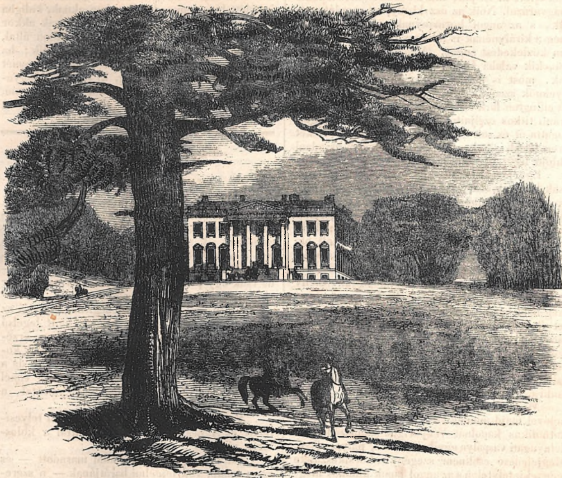
Claremont, Lajos Filep mostani lakhelye.

A Neuilly gróf, ez azon név, melyet az előbbeni francziák királya fölvetett: Claremont kastélyban, mely Londontól mintegy három mérföldre fekszik s a belga királynak, mint Charlotte angol hercegnő korábbi férjének tulajdona, left menhelyet s ott gyűjtötte össze maga körül minden gyermekeit s onokáit; kivéven az Orleansi hercegnőt, ki megvonulva a négy toronyban lakik Ems-ben. Így nyilatkozik az isten jósága s igazsága abban is, hogy azon egyetlen viszony, melyet Lajos Filep, emberi vélemény szerint, magának tisztán megtartott, családi viszonya, minőben nem csak legtöbb királyoknak, hanem sok magánosoknak is példányul szolgálhatna, zavaratlanul maradt meg neki, midőn mindenek elhagyták őt s jövendő nagysága fáradalmasan fölépített egész épülete romokban fekszik. O Angolhonban, noha annak sokat cselekedett ellenére s azt soha nem menthető módon megcsalta; mind azon tisztelettel fogadtatott, minő a szerencsétlenséget illet. S ha mindjárt népekjogi illedelem kormány tagjainak a megbukott királlyal minden közvetlen közlekedést tiltja is, még is maga Palmerston lord, kinek legtöbb oka volna rá nehezíteni, soha egy szót