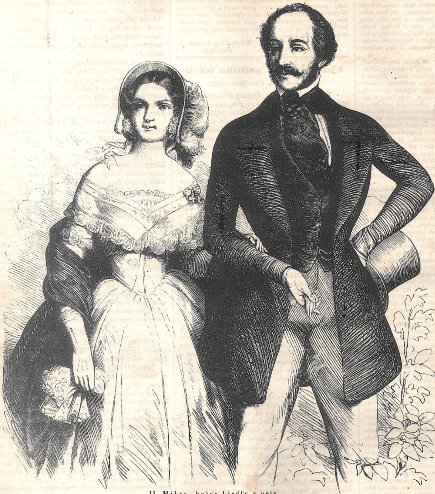
II. Miksa, bajor király s neje.

az urakodást átvette. Ez bajos időben történt, minő talpra esett férfit kíván, s már az illy időnek s illy igények eleven felfogása főkéletesen alkalmas arra, hogy kedvező előítéletet gerjessen az iránt, ki azt elismeri. Miksa nem ült készületlen a fejedelmi székre, noha Lajos király különöségei közé az is tartozott, hogy épen a koronaörökös az uralkodási foglalkodásokban minden részvétből kirekesztette, ha csak talán azon férfiaknak, kikben Lajos király oly soká helyhezte egyedüli bizalmát, a koronaherceg protestáns neje nem volt botránykó, mindazáltal a koronaörökös nem volt munkátlan, hanem komolyan iparkodott azon országnak minden viszonyaival megismerkedni, mellyen egykor uralkodandó lenne. Ő folyvásti viszonyban állott mind a két kamara notabilitásaival; sőt a legelhatározottabb ellenzék fő tagjaival gyakran leveleket váltott. Már első választásai bizonyosságul szolgáltnak a személyek pontos ismeréséről s azon szándokáról, hogy jeles férfiakat gyűjtson össze maga körül. A kamarák küldöttségéhez Mártzius 27kén tartott beszéde szinte annyi bátorságot mutat, s Bajorhon bátran remélheti, hogy illy uralkodó alatt önállását a nagy Németthon többi országai közt épségben fentartandja. Neje (szül. 1820) azon nagy erényel bír, hogy róla kevés van mondani való, mindenek előtt hű anya s jeles nő: különösen az ajánlja őt, hogy az 1846 év. apr. 14kén meghalálozott Wilma hercegnő leánya, ki „szegények anyja” nevet hagyott maga után.