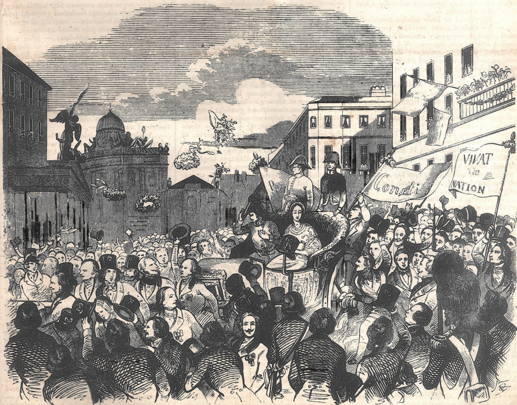
Ferdinand császár kikocsizása Martius 16kán Bécsben.

gokkal s kokárdákkal fölékesített tömérdek sokaság fogta körül a császári kocsit, mely előtt hosszú sorokban lépdelt a hirtelenében fölfegyverkezett nemzeti őrség, legtarkább vegyületben s legfuresább szinpadi öltözetekben.