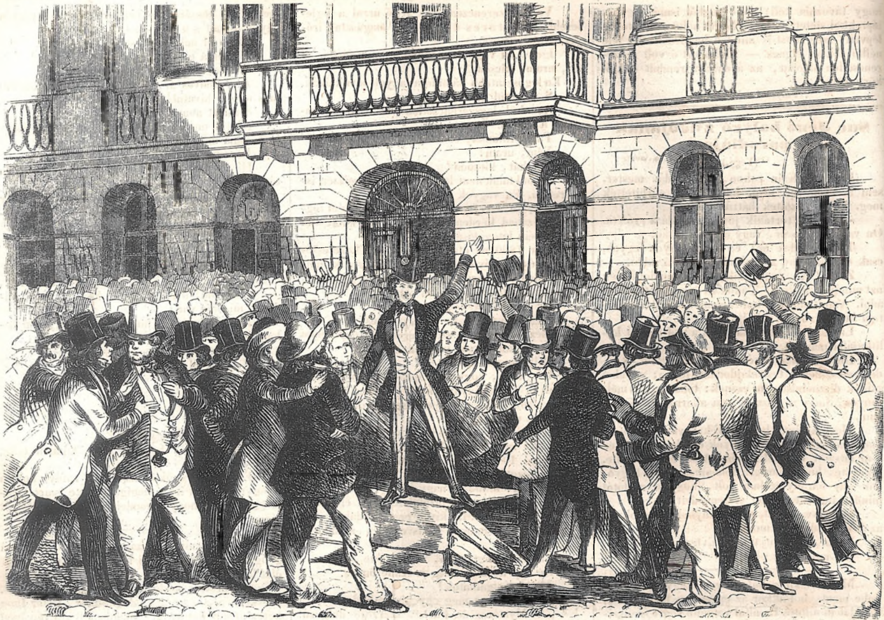
Népszónokok az alsó austriai rendek háza előtt Bécsben.