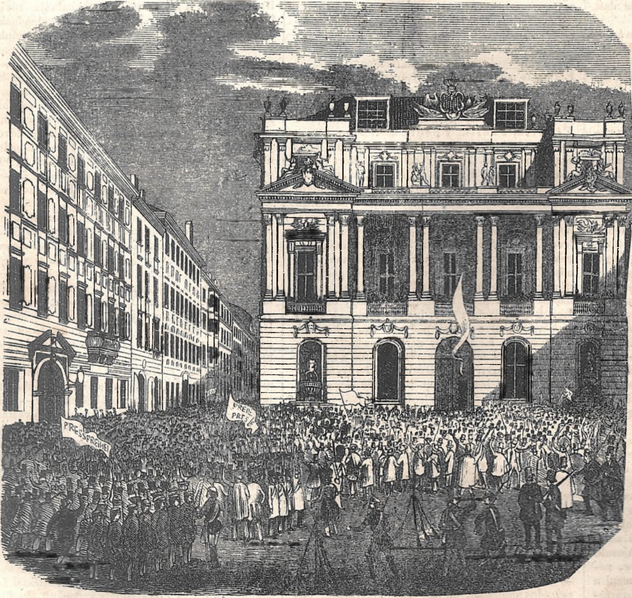
Az egyetemi piac Martius 13ról 14ére menő éjel Bécsben.