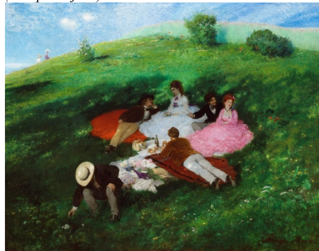
(3. kép: Majális)

Egy profán impresszionista, a természetet, az emberi harmóniát, a közösségi együttlét boldog érzését és élményét hordozó alkotás. Nincs mit tagadni, erre vágyunk. Magunkban, családjunkban, közösségi életterületben.