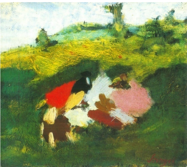
(2. kép: Vázlat)

Ezen a színvázlaton már érződik a kép hangulata. A színek harmóniája mutatja, hogy jó irányba halad az alkotó munkája. Itt a sokszínűség harmonikus együttlétének ábrázolása a legfontosabb. A színek elfogadják és kiegészítik egy mást. Törekednek az összhang irányába. Mint egy család, egy közösség, melyet a sokszínűség jellemez. Ennek a formálódó képnek is része vagy. Lehet, hogy