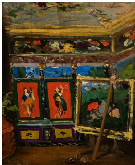
(1. kép: Műterem)

Elviszlek Titeket egy kiállításra. Az a kép - amelyet most on-line megosztok Veletek - azt mutatja, hogy a festőjének van valamiféle elképzelése. Még nem igazán tudja, hogy mi lesz pontosan az alkotása, de érzi, hogy még sokat kell dolgoznia