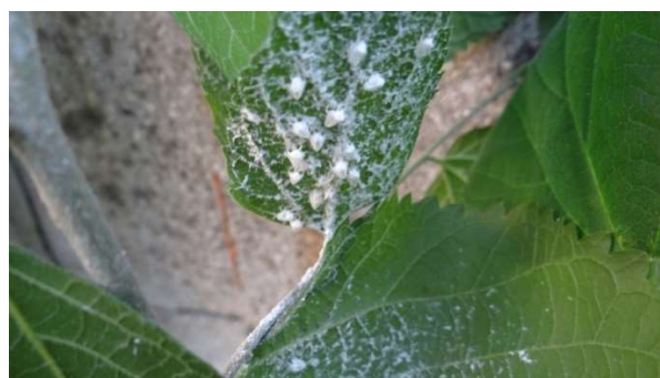
az első vedlés után ottmaradt lárvaingek

Bizony ezidáig határozott egyértelmű választ nem kaptam erre a nemzedékes kérdésre, de az elhúzódozó keléskéből származó különböző fejlettségű lepkekabócák elméletét cáfolni látszanak a saját felvételeim. Egyszerre van jelen a kifejlett – a szakemberek imágónak mondják – és az éppen kelő utódok. Szeptember végére talán eldöntik