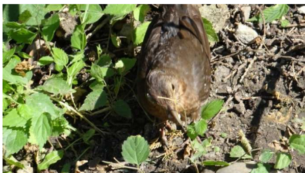
Csőrében egy lepkekabóca imágó

Nagy terméssel kecsegtetett a városi bokrunk és már a második érési csoport is ott tolakodott az érőfélben lévő társai mögött. Fügelekvár befőzési terveink mégis hamar szertefoszlottak, mert versenyt kellett együk a termést a rigókkal. Lett más kártevője is a kertnek, nevezetesen az amerikai lepkekabóca. Megtaláltuk őket a fügebokron is, miután a kertben gyomfaként felszaporodott nyugati ostorfa ( Celtis occidentalis ) gyökérsarjait is kivágtam. Jobb híján ráfanyalodtak. Vegyszeres védekezés eszembe se jutott, hiszen érőfélben lévő gyümölcsöt csak nullanapos élelmezés egészségügyi várakozási idejű rovarölővel lehetne permetezni, olyan meg nincs s ha mégis lenne sem használnám. Ezekről a viaszos bőrű kabócákról egyébként is lepereg a permetlé, igazán hatékony felszívódó hatóanyagú készítményekből már éppen eleget eszünk a szép tetszetős gyümölcsökön. Maradna a mechanikai védekezés ellenük – növényvédősök tréfás szakzsargonjában; peszticid manual – de mire odanyúl az ember, hogy nyakon csípje, már el is pattant, mint a bolha. Szerencsére azért van tőlünk ügyesebb segítő társunk is a gyéritésükben, mégpedig a torkos feketerigók között.