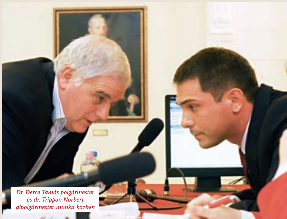
Dr. Derce Tamás polgármester és dr. Trippon Norbert alpolgármester munka közben

Az azóta eltelt időben támogatásoddal, a tapasztalatoddal, rutinoddal, jó tanácsaiddal segítettél abban, hogy megvalósíthassuk az újpestiek által megkedvelt új Főteret, a méltán ismert és elismert VirágVáros-programot. Együtt dolgoztunk azon, hogy felújítsunk több tucat játszótérrel és parkot. Létrehoztuk az Újpesti Közterület-felügyeletet, új helyre költözött a Gyermekszakrendelő, az idén elkészül az