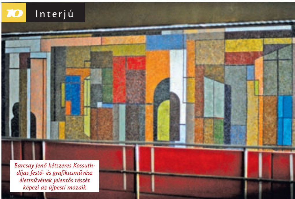
Barcsay Jenő kétszeres Kossuth-díjas festő- és grafikusművész életművének jelentős részét képezi az újpesti mozaik