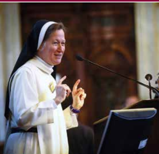
PÉNZ ÉS ERKÖLCS