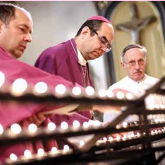
MISE A HAJLÉKTALANOKÉRT