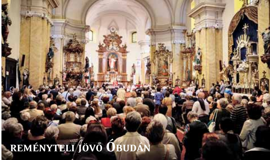
REMÉNYTELI JÖVŐ ÓBUDÁN

Ünnepi szentmisét mutatott be Erdő Péter bíboros az ezeréves fennállását ünneplő óbudai Szent Péter és Pál-főplébánia közösségének, június 28-án. Szentbeszédében úgy fogalmazott: az Egyház láthatatlan alapja maga Jézus, a látható pedig Péter apostol, a szikla és az utódok. Ez a templom is krisztusi alapra épült, „ezért fakadhat belőle új élet, értelem és optimizmus minden nemzedék számára”. Hozzátette: ezért lehetett Óbuda központja, ezért tud a Krisztusba vetett hit egész emberi közösségeket megalapozni. „Városokat, falvakat, vagy akár egész országokat is. Mert minden kultúra központjában a világnézet áll. Mert minden emberi közösségnek, hogy az élete értelmes legyen, hogy érdemes legyen fáradoznia a jövőért” – hangsúlyozta a bíboros.