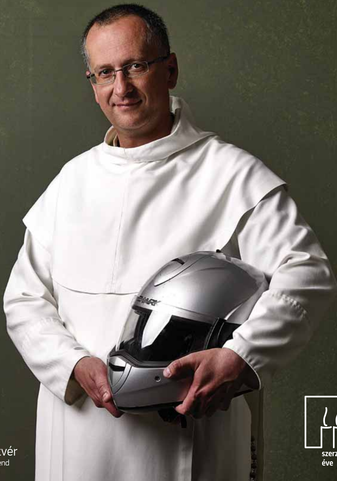
Botond testvér Magyar Pálos Rend