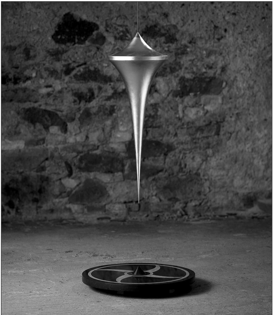
Menasági Péter: Kozmogónia