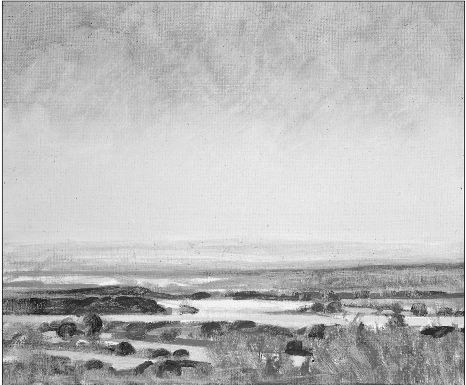
Csáky Donát Márk: Kis lebegő 1.