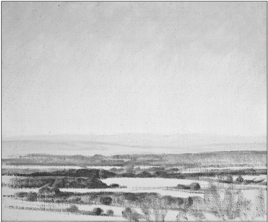
Csáky Donát Márk: Kis lebegő 2.