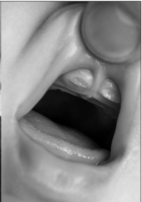
Gáldi Vinkó Andi Sorry I Gave Birth I Disappeared But Now I'm Back című sorozatából