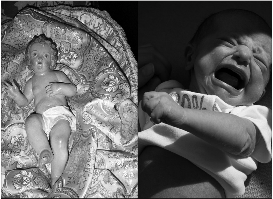
Gáldi Vinkó Andi Sorry I Gave Birth I Disappeared But Now I'm Back című sorozatából