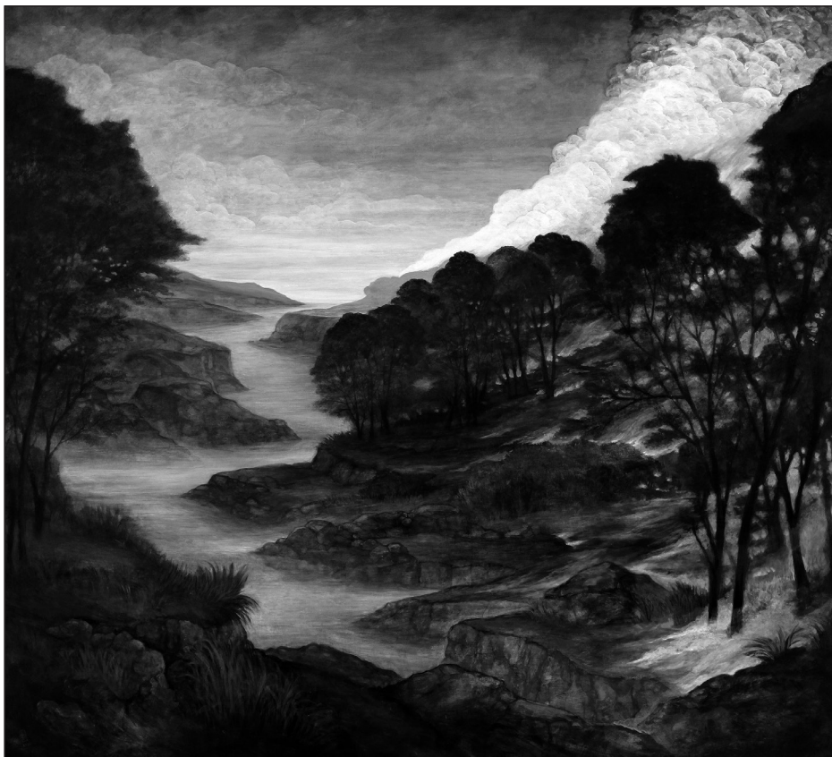
Szurcsik József: Incendium (Gyűjtogatás, Tűzvész) (2022)