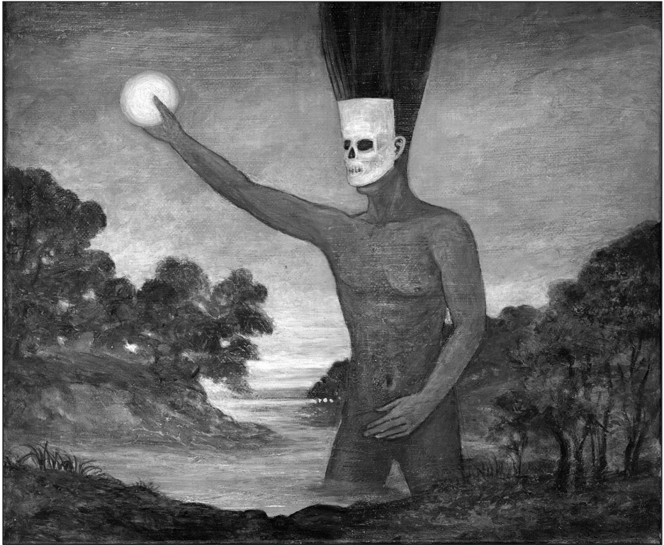
Szurcsik József: Angelus elfogja a napot (2023)