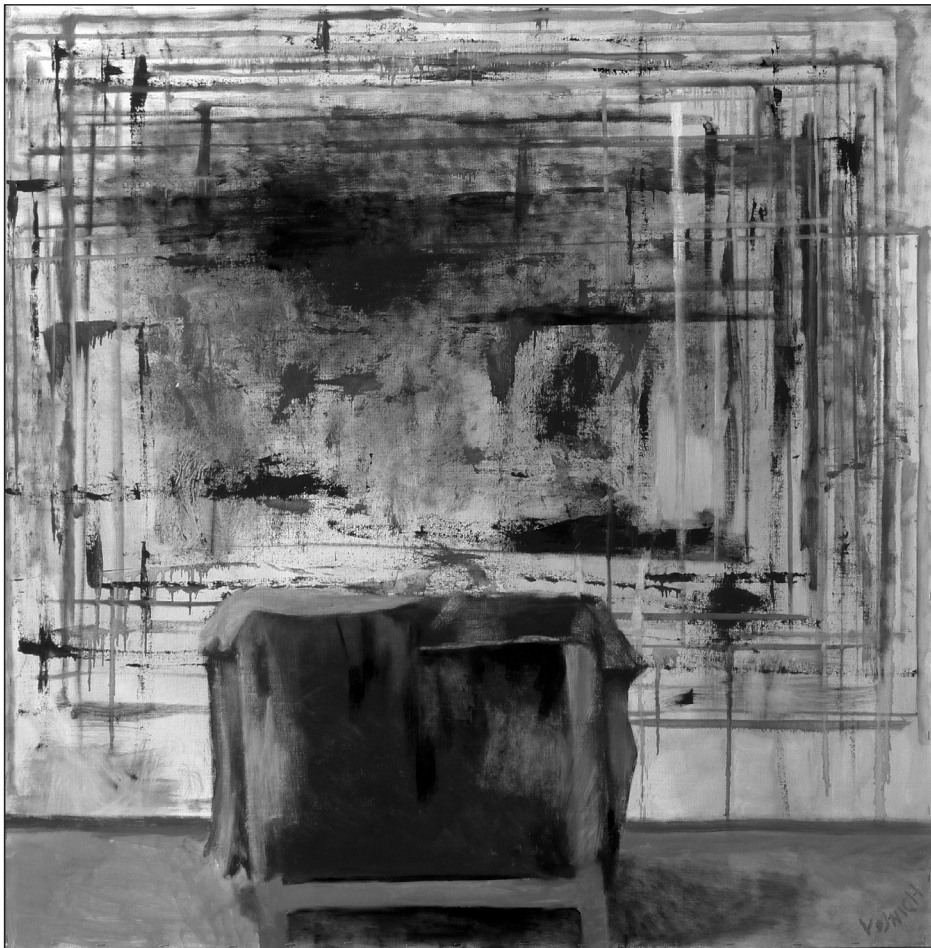
Vojnich Erzsébet: Múterem 1.