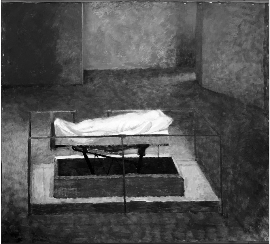
Vojnich Erzsébet: Ravatal