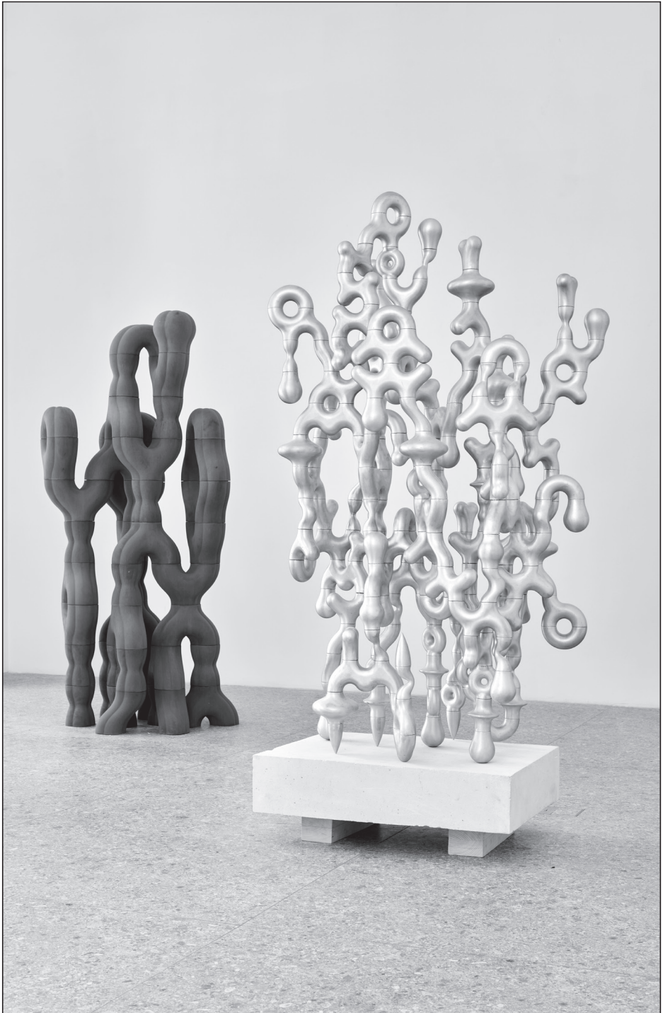
Melkovic Tamás: Chance of Waves