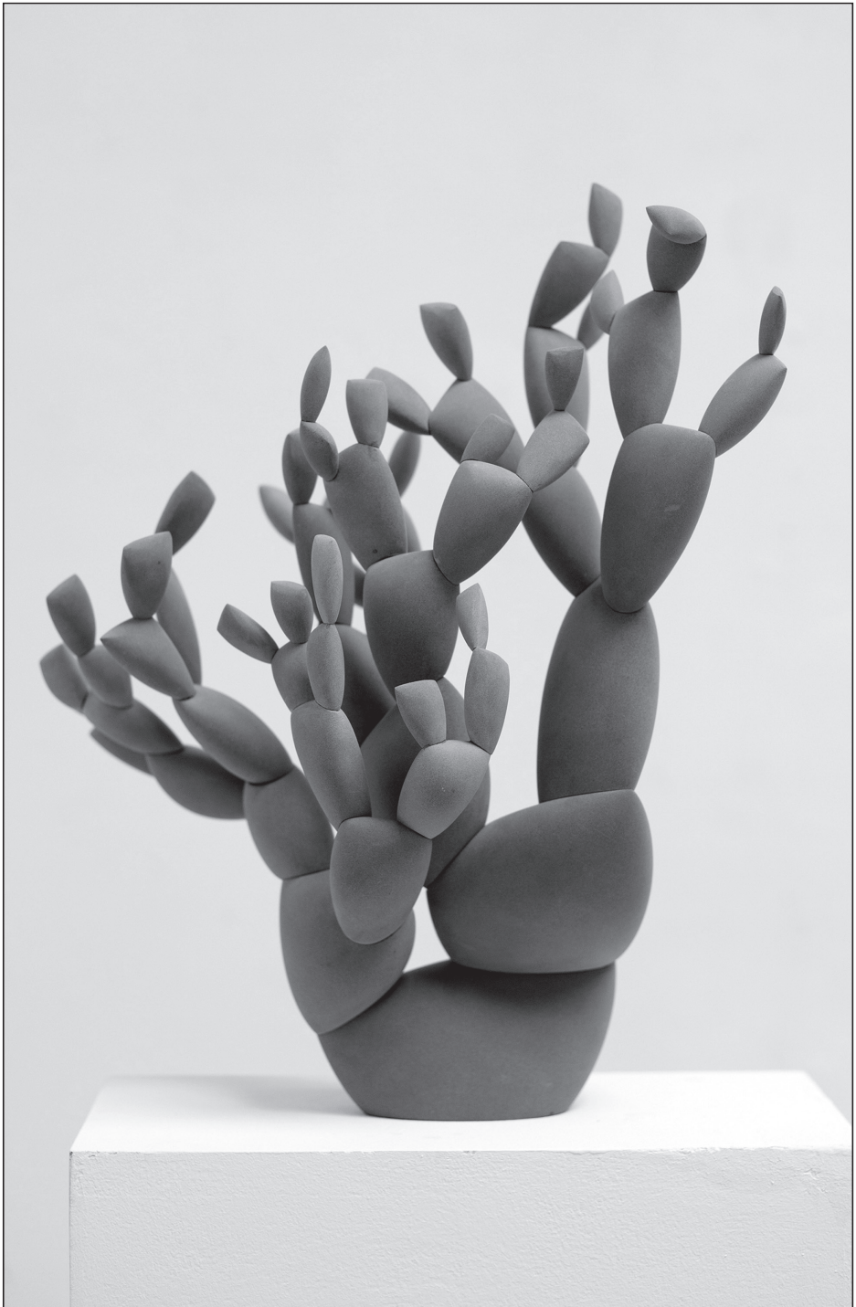
Melkovics Tamás: Kaktusz széria