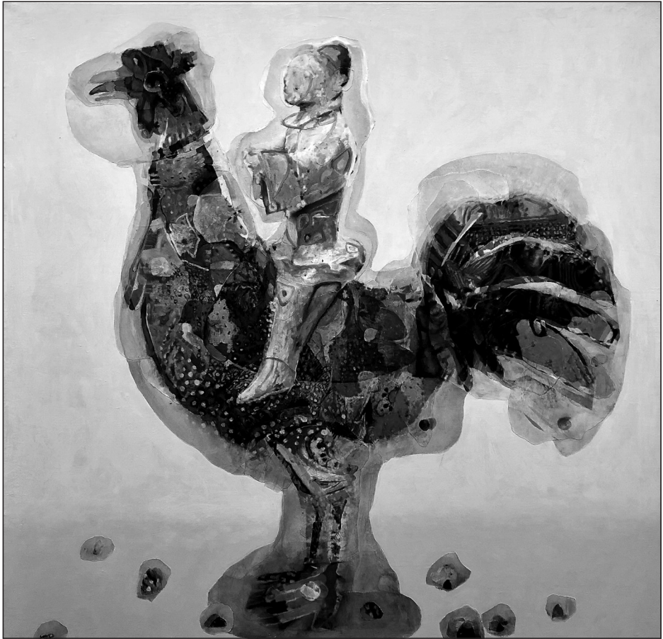
Duliskovich Basil: Neglected Happiness