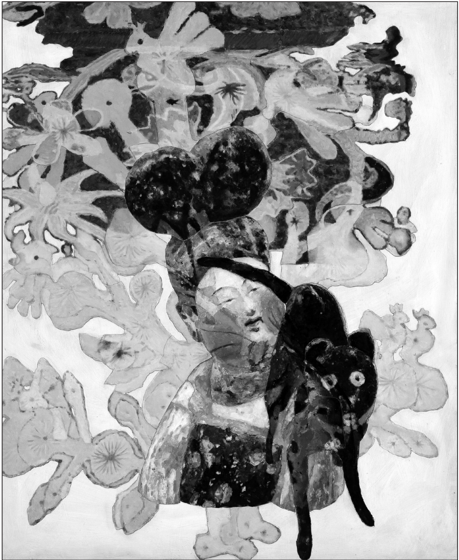
Duliskovich Basil: The Right View Direction