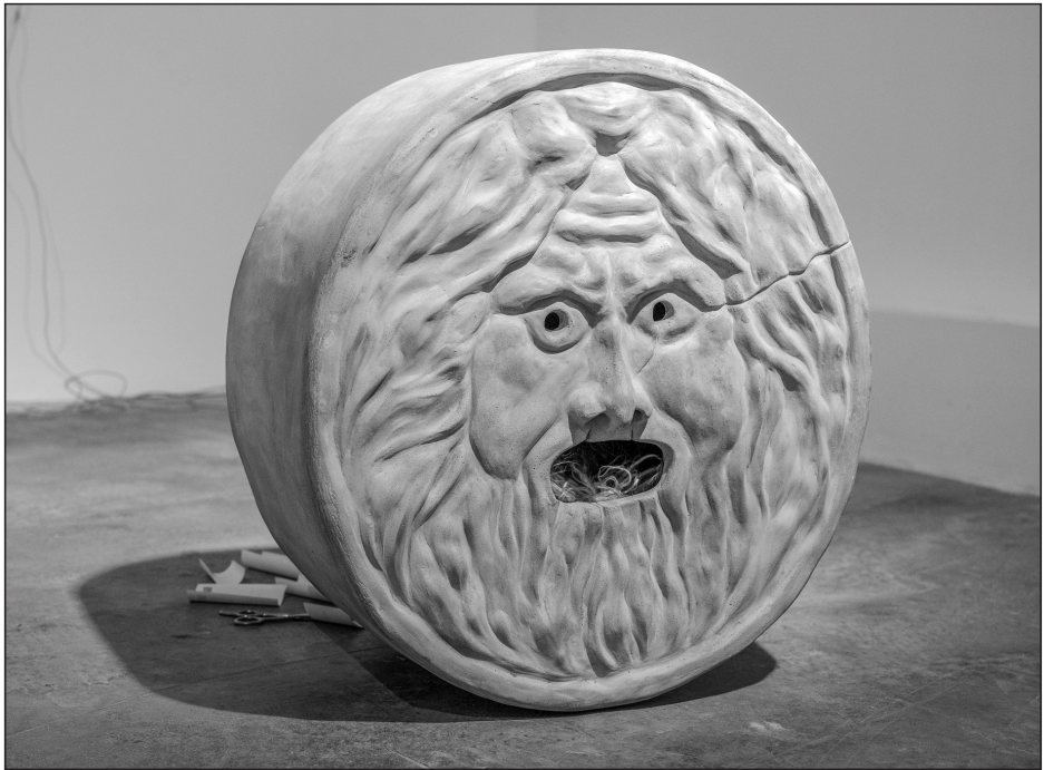
Kortmann-Járay Katalin: Az igazság szája (Csillagok között)