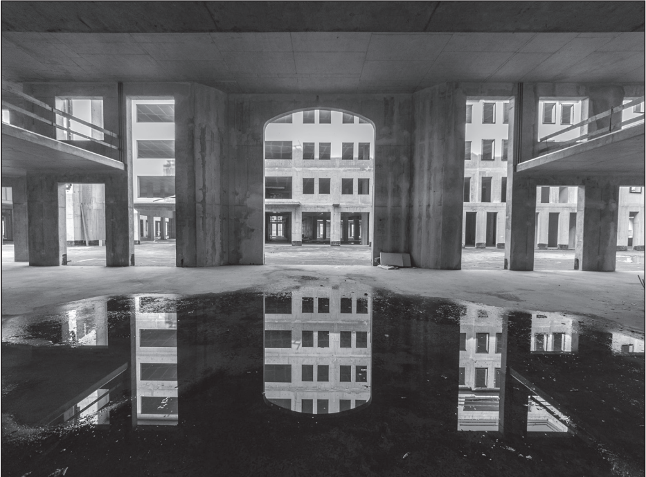
Urbán Ádám: Népstadion (sorozat)