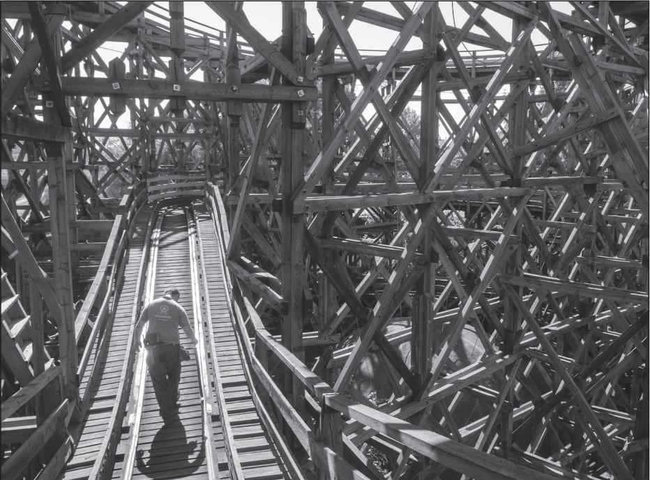
Urbán Ádám: A vidámpark láthatatlan dolgozói (sorozat)