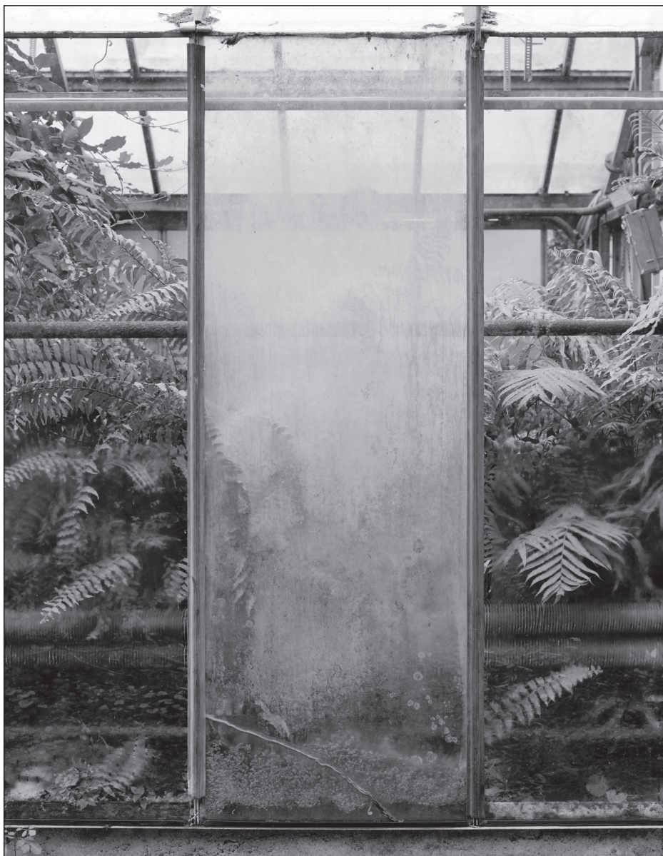
Urbán Ádám: Emlékezés a jövőnek, figyelmeztetés a jelennek (sorozat)