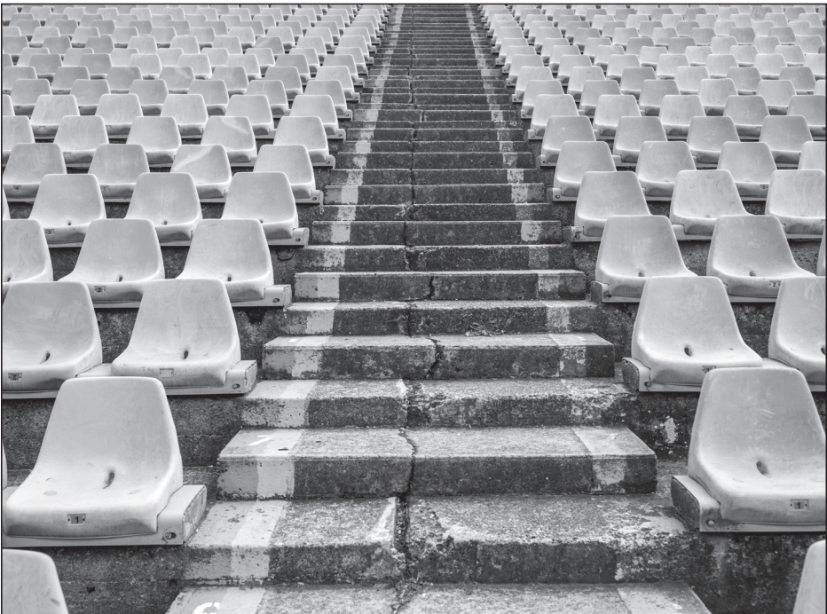
Urbán Ádám: Emlékezés a jövőnek, figyelmeztetés a jelennek (sorozat)