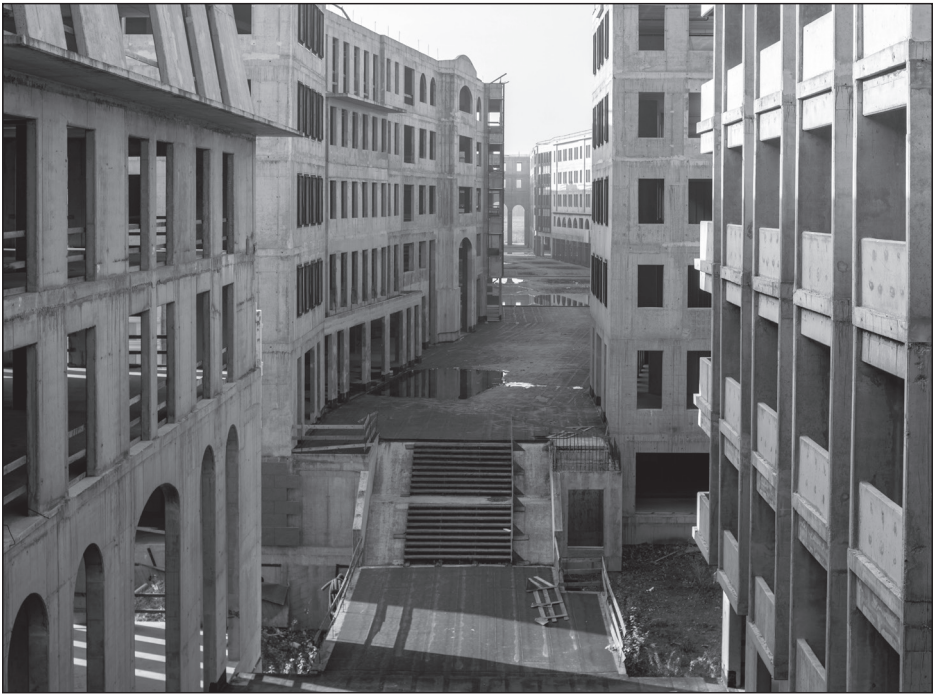
Urbán Ádám: Népstadion 2017 (sorozat)