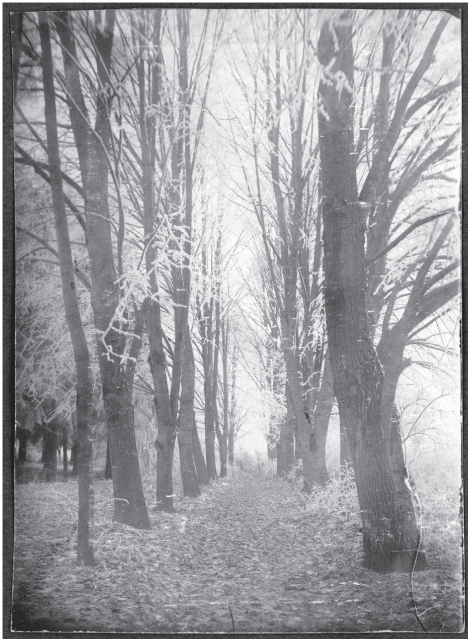
1921. december – A hársfasor a kert jobb oldalán vezetett ki a mezőre. Még nagyapám telepítette ide őket. Hat fa maradt meg belőle. Nagyon szerettem.