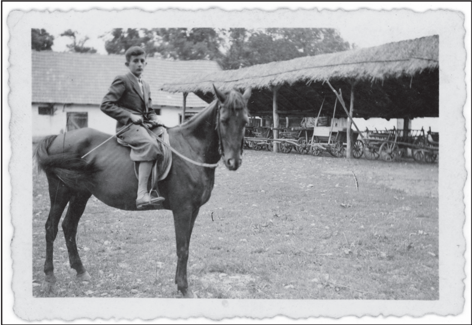
1943. július 28. – Tíz évvel később, már megtanultam lovagolni én is. Mondták, hogy így csináljam, úgy csináljam; ha üget vagy vágdat, máshogy kell az embernek tartania a lábát. Gondoztam is a lovat. Az állatok is ott maradtak aztán, amikor el kellett jönnünk 1944-ben.