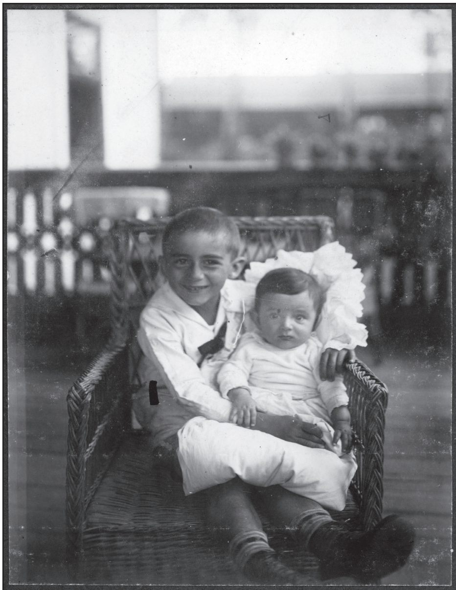
1928. május – Félévesen a bátyám ölében a kerti teraszon.