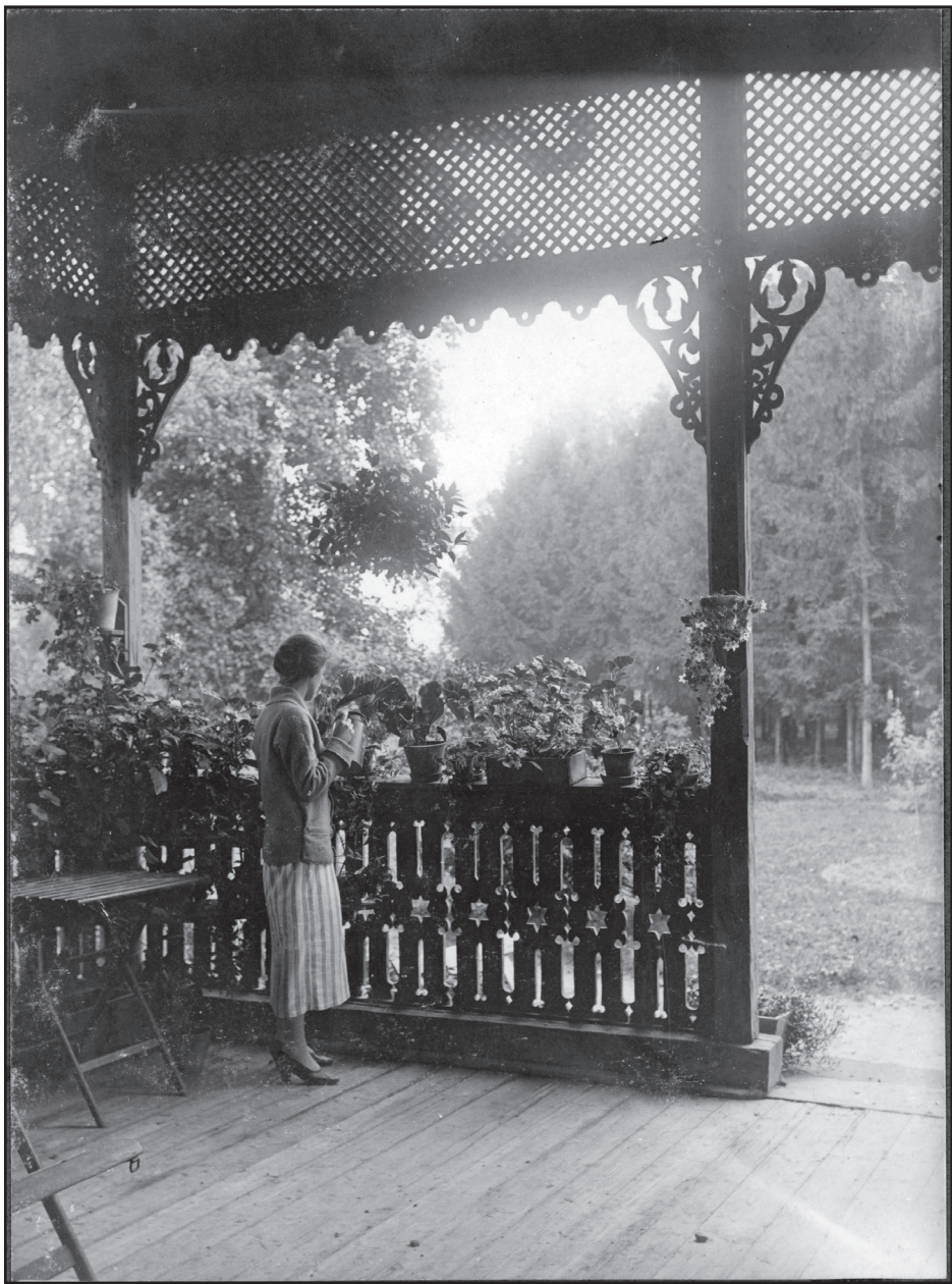
1925. szeptember 28. – Anyám a virágai mellett.