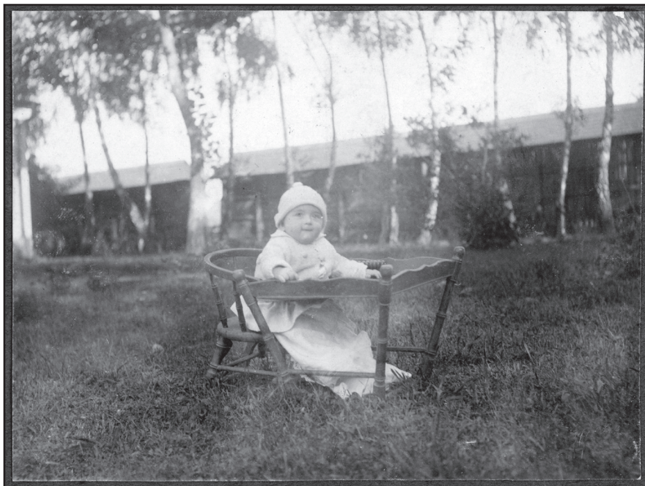
1922. szeptember 19. – Bátyám 1922. január 19-én született, itt éppen nyolc hónapos. A kertben, a járókájában ül, mögötte a kerttől a baromudvart elválasztó nyírfasor és a kas. Ez vékony lécekből épült, ősszel ide tették a kukoricát száradni, mert jól átjárta a levegő.