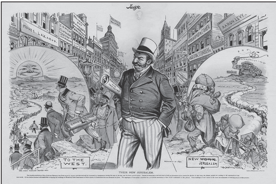
Az Új Jeruzsálemük. The Judge Magazine (1892)

otthonukul az Egyesült Államokat, 3 annak a szellemiségnek a reményében, amely Emma Lazarus portugál eredetű New York-i jómódú szefárd zsidó család lányának 1883-ban írt költeményéből ( Az új kolosszus – The New Colossus ) köszön vissza. A költemény az 1886-ban felavatott Szabadság-szobrot szólította meg (Statue of Liberty), s jóllehet, a Szabadság-szobor, Franciaország ajándékeként, az Egyesült Államokból a világ felé szétáradó szabadság feltartóztathatatlan szellemét törekedett kifejezni, ám Emma Lazarus épp ellenkezőleg, a szobor gigantikus nőalakjában a világ üldözötteinek, elnyomottainak, menekülteinek otthont adó szimbólumot, a befogadás gesztusát találta meg