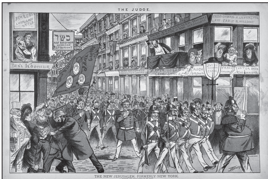
A New Yorknak mondott új Jeruzsálem, Judge Magazine (1882)

amelynek jelentősége folyamatosan növekszik.” 11