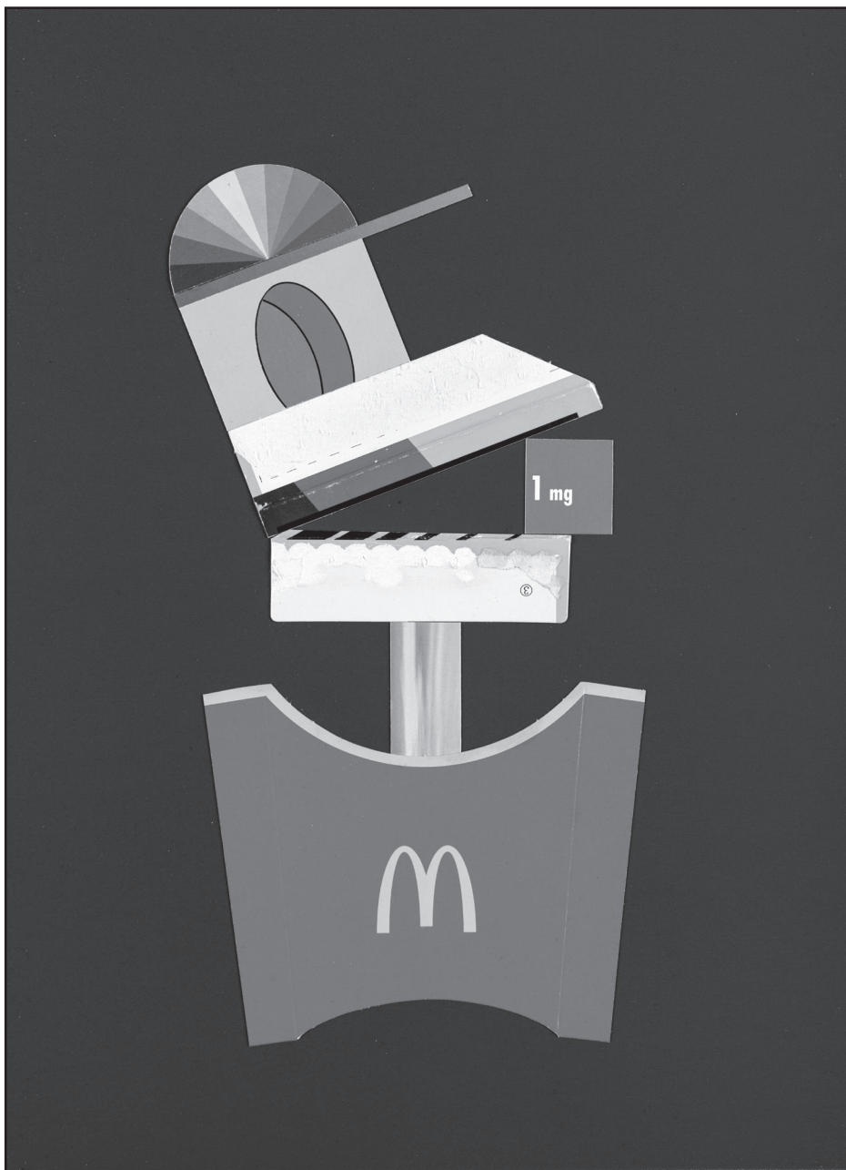
Batykó Róbert: Lovin' It