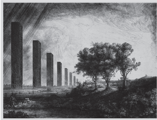
Bodonyi Zoltán: Kilenc torony