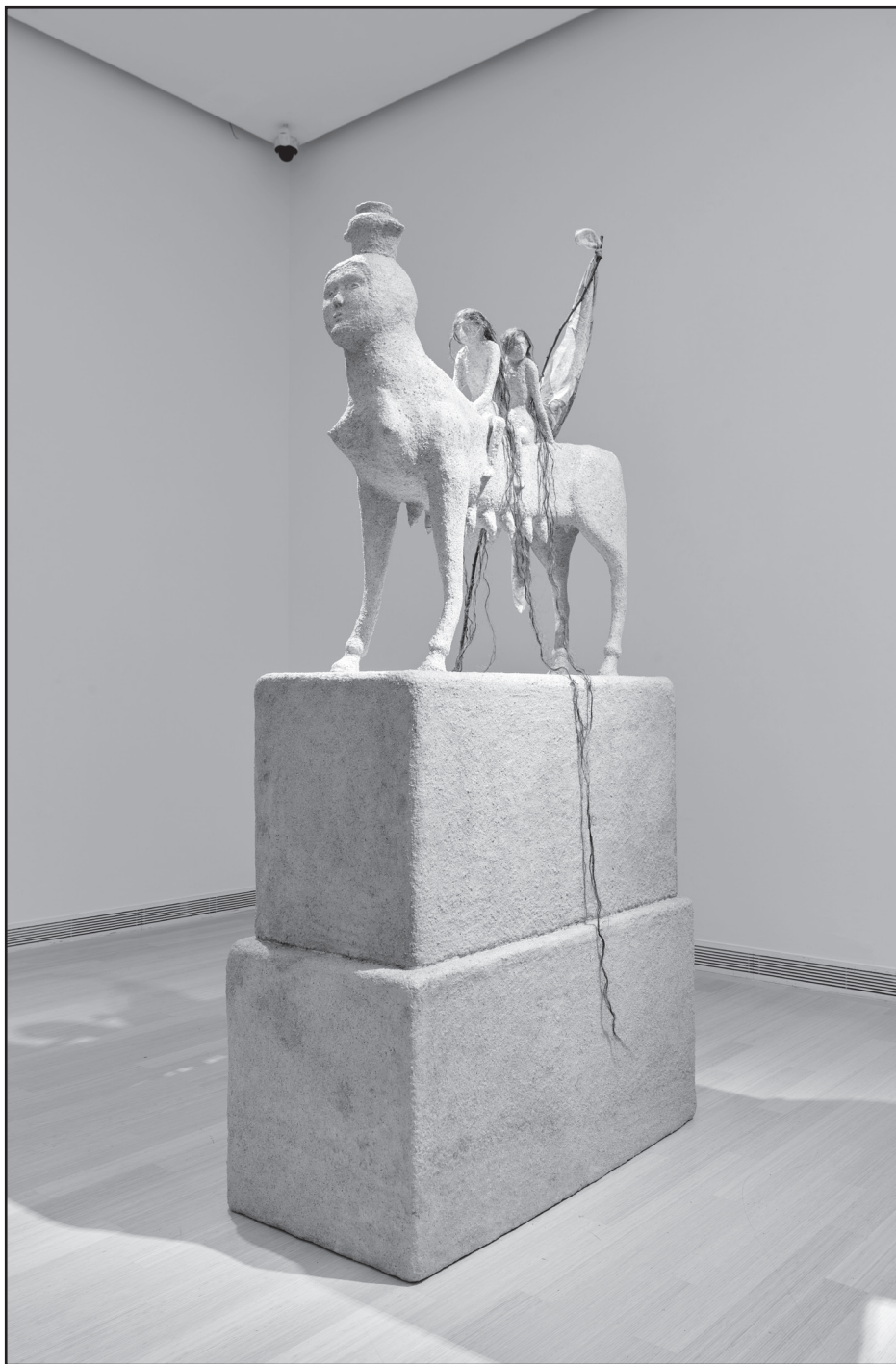
Tranker Kata: Az anyatermészet lovasai