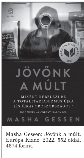
Masha Gessen: Jövünk a múlt. Európa Kiadó, 2022. 552 oldal, 4674 forint.

A világnézeti űrben és gondolati antinómiákban élő ember számára az az idea lehet a legvonzóbb, amely önkényességénél és partikularitásánál fogva tetszőleges tartalommal tölthető ki. Ez a nemzeti gondolat, amely sohasem lehetett valamilyen megfogható idea, mivel minden nemzet mindenféle gondolattal, törekvéssel, világnézettel élő vagy nem élő emberek heterogén csoportja, tehát csak önkényesen lehet közös gondolati tartalmat hozzákapcsolni, úgy azonban bármilyet. Aszerint, hogy a nemzet mely részét