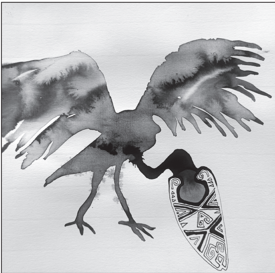
Bánkúti Gergő: Állatok furá dolgokat csinálnak (10)