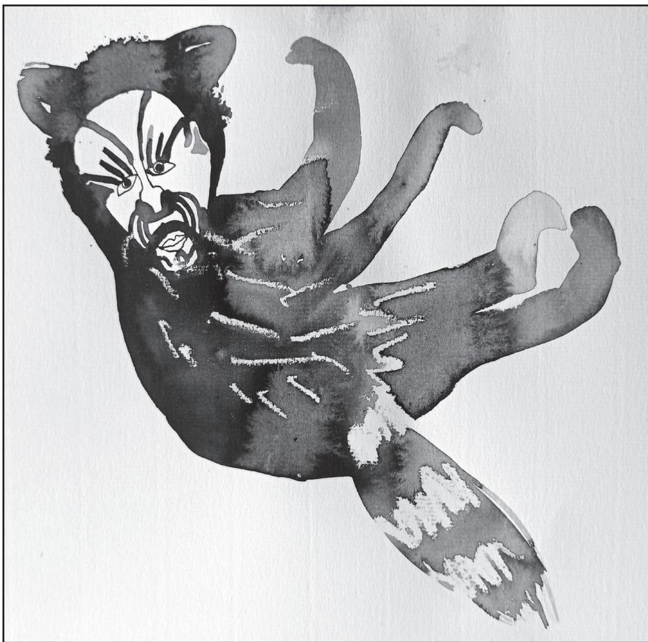
Bánkúti Gergő: Állatok furá dolgokat csinálnak (14)