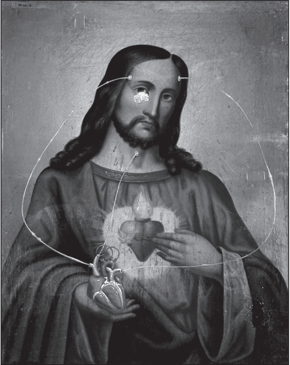
Elekes Károly: Szívek