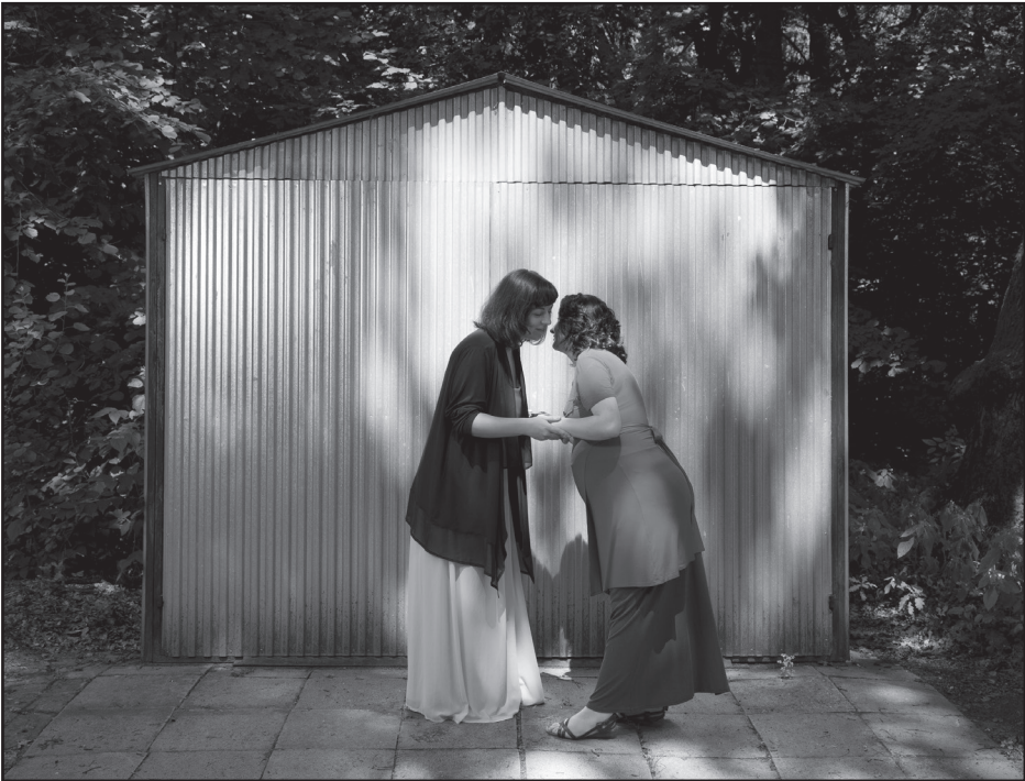
Fátyol Viola: név nélkül