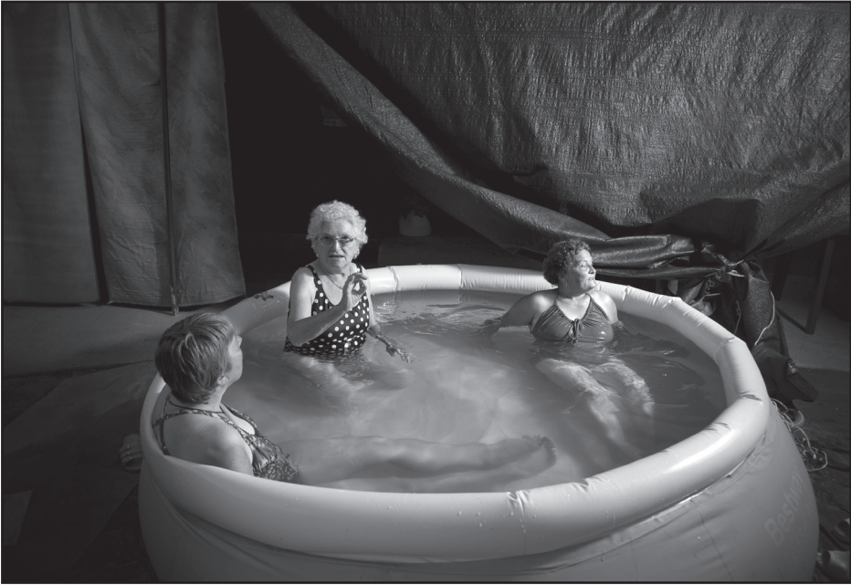
Fátyol Viola: Ha van szíved, neked is fáj, amit velem tettél / Erzsike medencéje