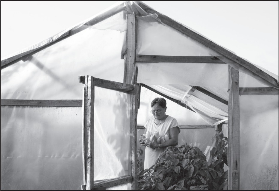
Fátyol Viola: Ha van szíved, neked is fáj, amit velem tettél / Üvegház