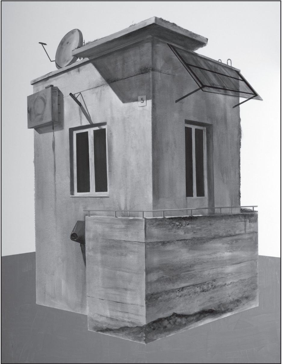
Herman Levente: Egyszemélyes