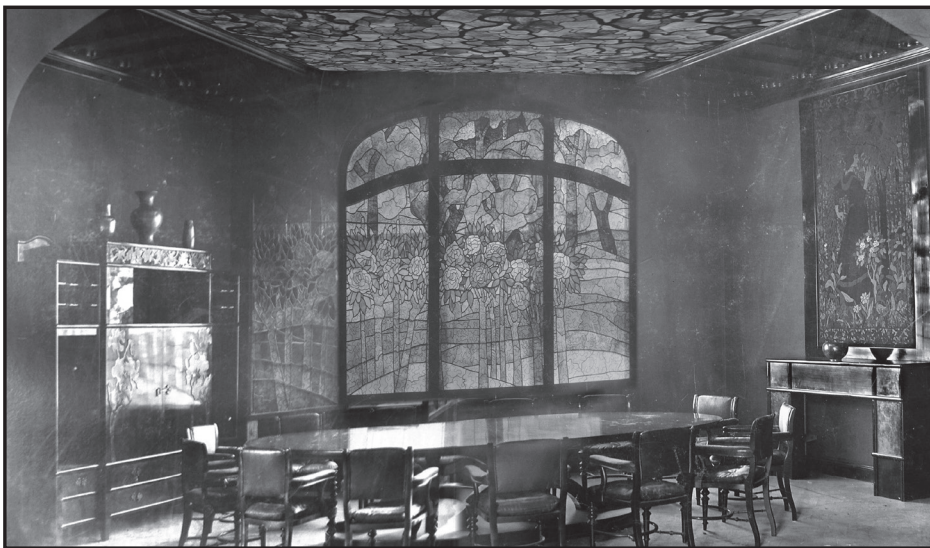
Az Andrassy-ebédlő, 1898. Korabeli archív fotók alapján készült digitális rekonstrukció

a mai technikai feltételek között az ilyeneket is lehetséges; a kérdés csak az, hogy érdemes és tisztességes-e. Sosem lesz olyan, mintha az eredeti élte volna túl a történelmi megpróbáltatásokat. Vagyis kérdés: nem csapjuk-e be a publikumot azzal, ha az eredmény pusztán – miként maga Rostás Péter mondja – egy „1:1 léptékű makett”. Természetesen ennek is – mind a kivitelezésnek, mind a bemutatásnak – van vagy lehet indokoltsága. A töredékek értelmezése vagy a romok helyén létesült új változattal való szembesítés szakmai, esetleg közvélemény-formáló tanulságai okán például. Vagy ha történetesen a nemzeti kulturális örökség elévülhetetlen eleme. Netán olyan fontos és szerves része valamely oeuvre-nek, hogy nélkülözhetetlen az adott életmű megértéséhez. Ilyen körülményekről a Szent István-terem esetében nem tudunk. A királyi koronát nem itt őrizték, a Szent István-terem, a legtöbb Schatzkammerral ellentétben, nem vált zárandokhely-