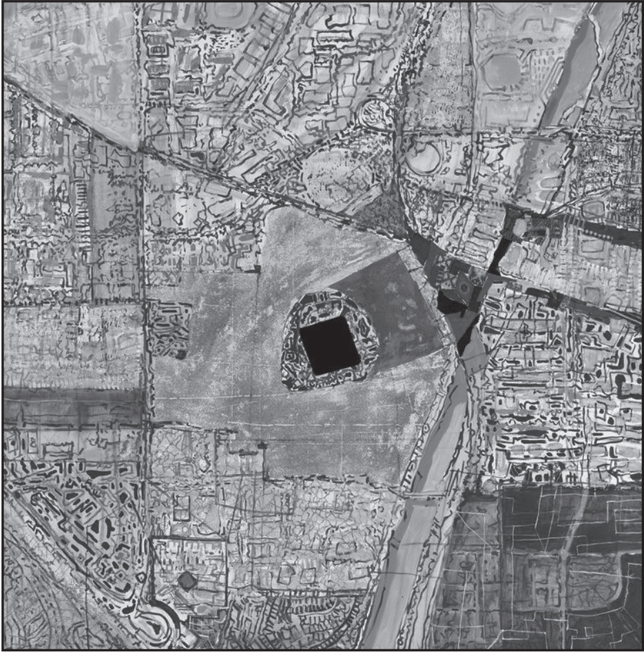
Byhon Győző: Szakrális város