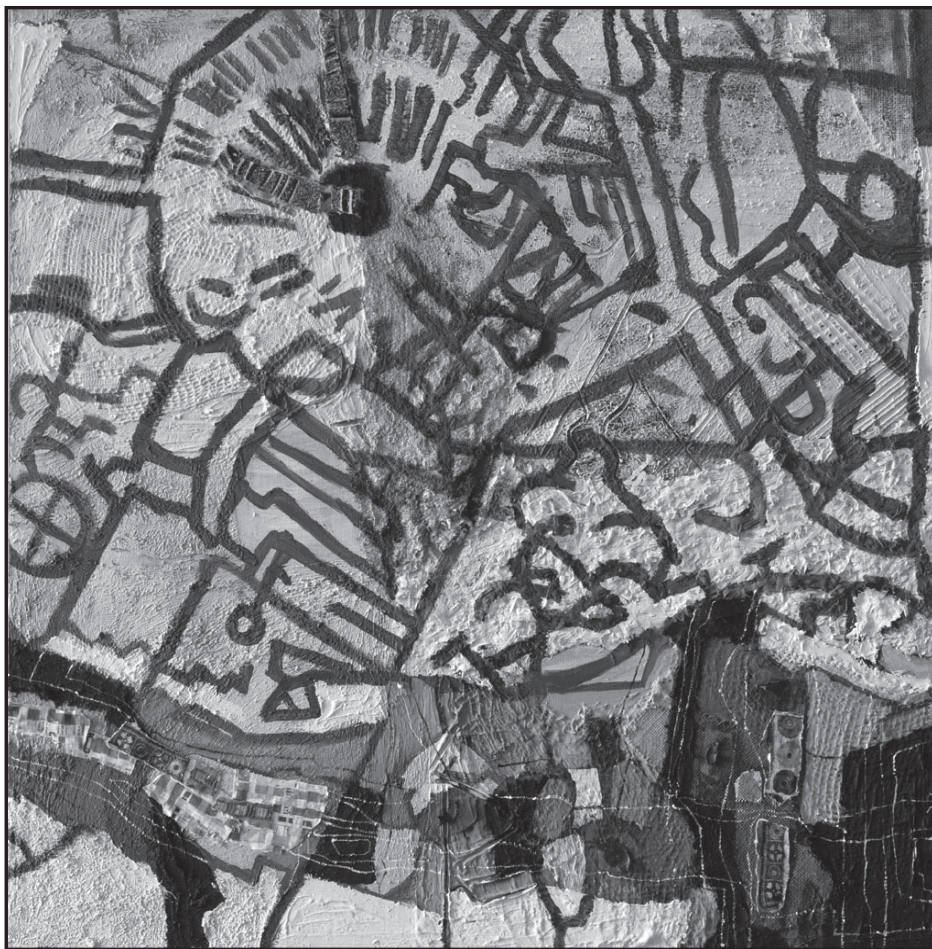
Byhon György: Lourdes