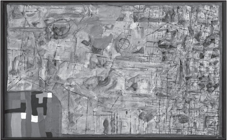
Byhon Győző: Szíria