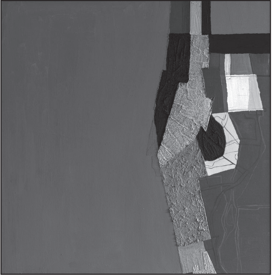
Byhon Győző: Sziget