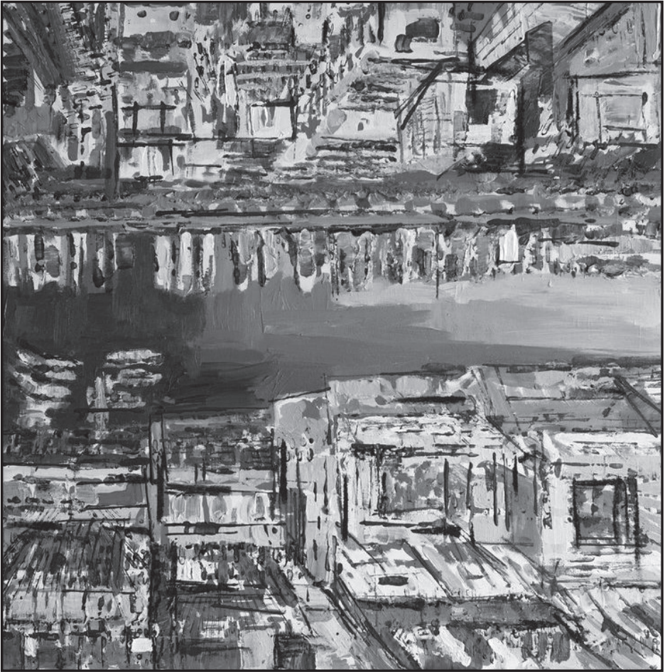
Byhon Győző: Amsterdam