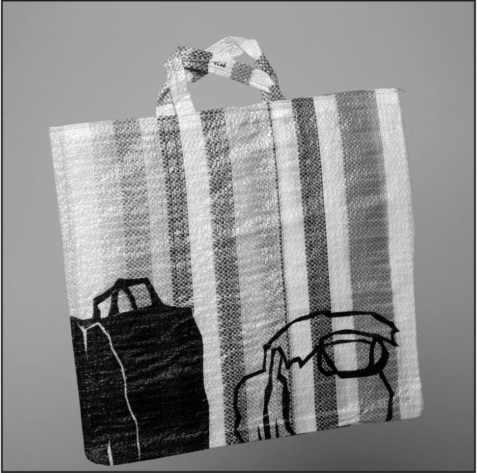
Födő Gábor: Szatyrok