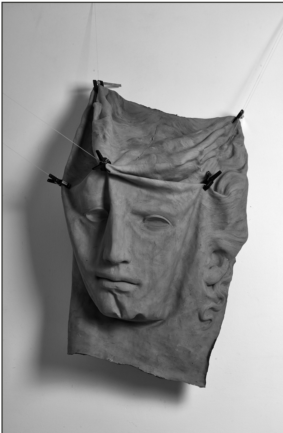
Szabó Menyhért: Who You Are II.