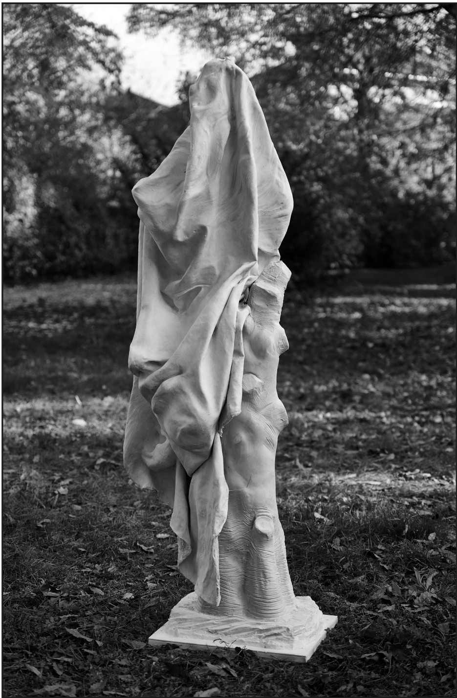
Szabó Menyhért: Cím nélkül