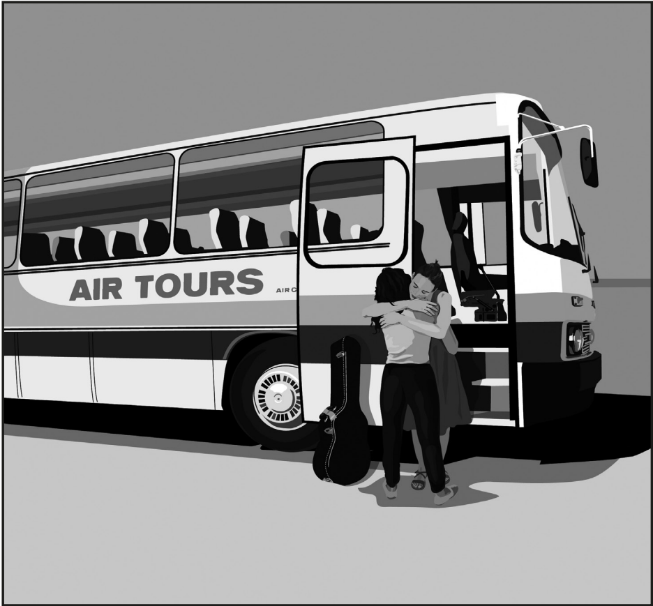
Weiler Péter: Air Tours