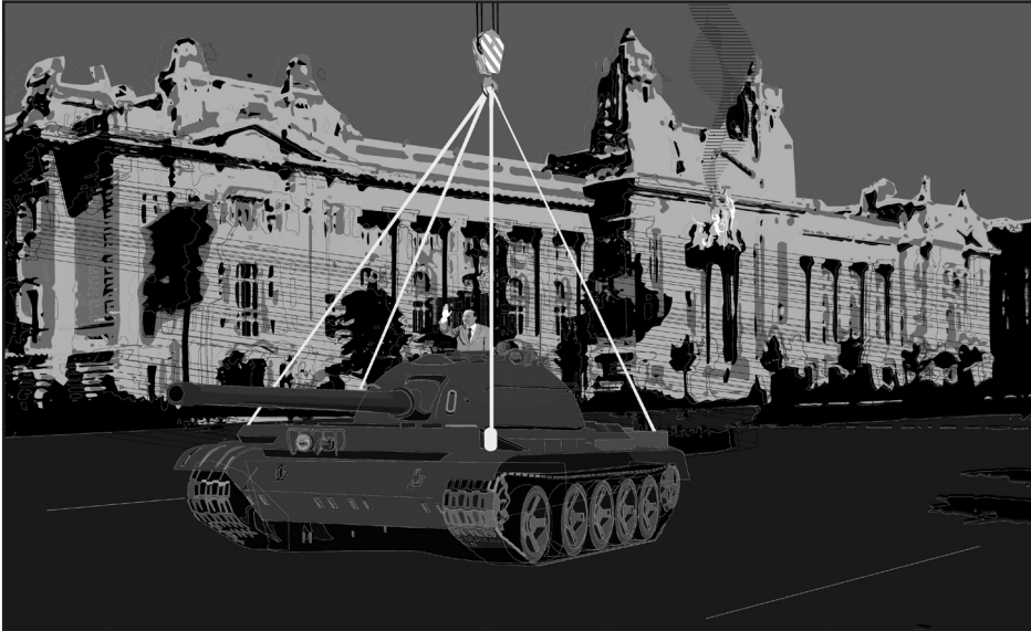
Kádár újra Budapesten, rossz cím: Szabadság tér (1956. 11. 07.)