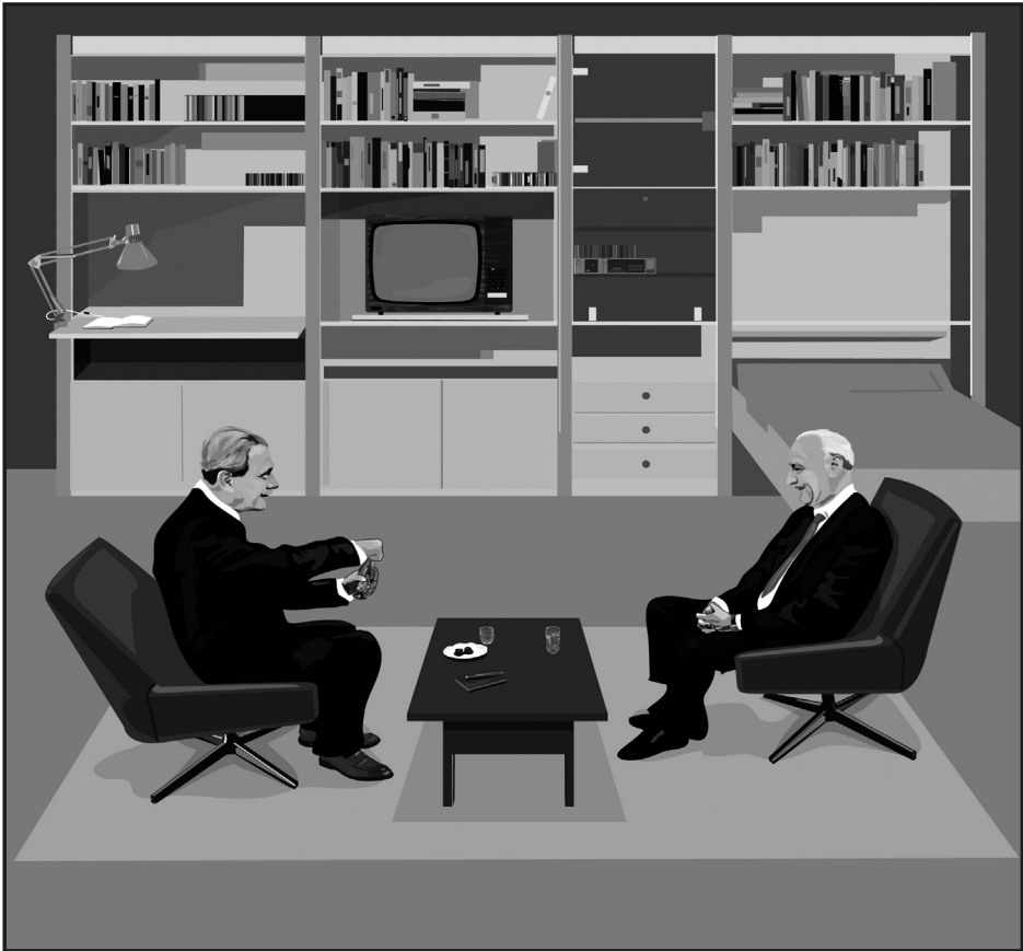
Weiler Péter: Aczél és Kádár a gyerekszobámban beszélnek meg az ország ügyeit