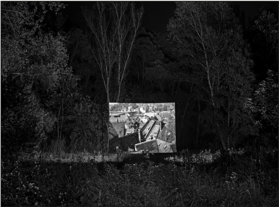
Szalai Eszter: Reflektált múlt