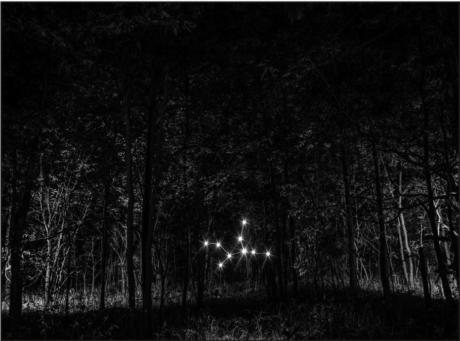
Szalai Eszter: Végtelen