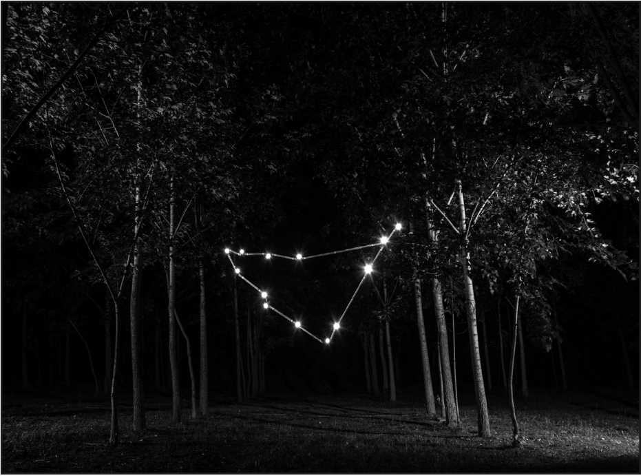
Szalai Eszter: Végtelen