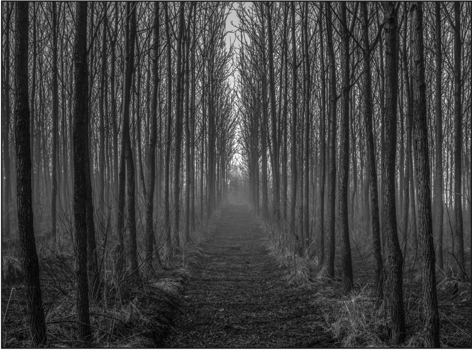
Szalai Eszter: Mesterséges természet