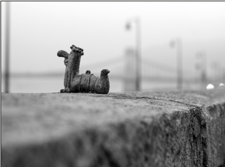
Kolodko Mihály: Főkukac miniszobra (Budapest, 2016)

Amiben pedig a jövőre tekintve is biztosak lehetünk: a kurd csomót egyhamar nem sikerül elvágni. Az elégedetlenség – éppúgy, mint a világ legnagyobb „hontalan” etnikumának szétdaraboltsága – tartós viharfelhőkkel fenyeget. De a legtöbb kurd kora kölyökkorában megtanulja ősrégi közmondásukat: „Jobb harcolni, mint karba tett kézzel ülni!”