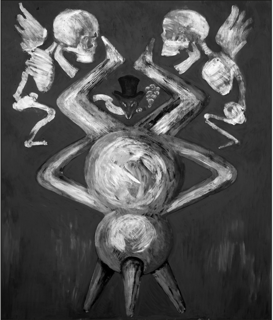
Roskó Gábor: A nagy szívás