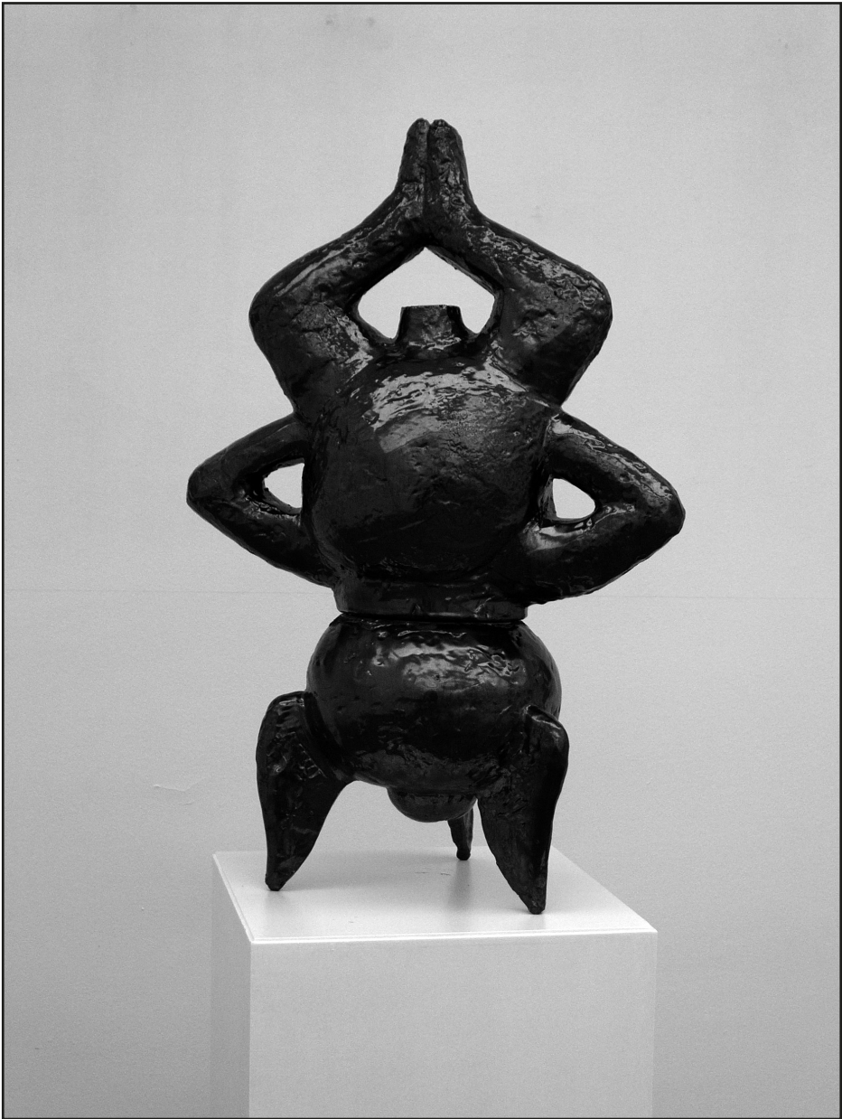
Roskó Gábor: A panaszos