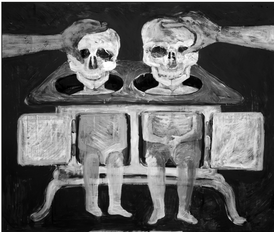
Roskó Gábor: Előre megmondtam