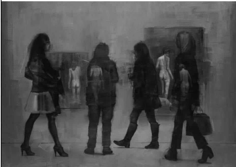
Women with a view of women