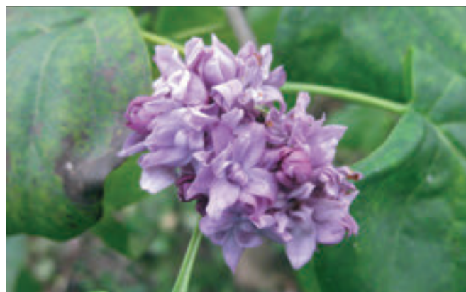
A hosszú, enyhe őszben újra virágzott az orgona, igaz csak az ág végén. A felvétel november 22-én készült

Az „Olvasók Fóruma” című rovatunk a januári számban indul.