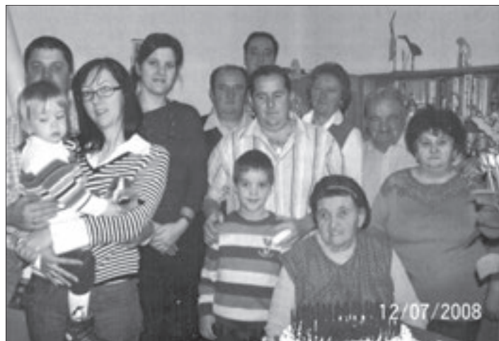
A 80. születésnapon