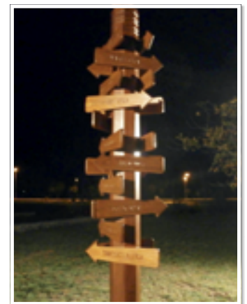
Esti megvilágításban az új kopjafa a volt utcák névtábláival

Devecser, Czeidl József Fotó: Czeidl József