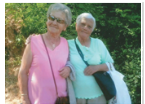
A két Szabóné: Antalné és Kálmánné