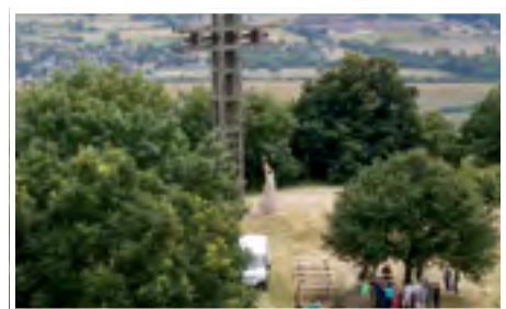
Óriás kereszt és a Szent Istvánt ábrázoló szobor