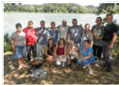
Főzőverseny Nagypalád-Fertősalmás csapata