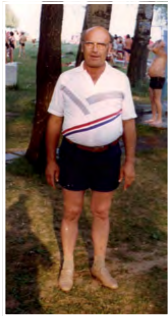
A sárvári fürdőben