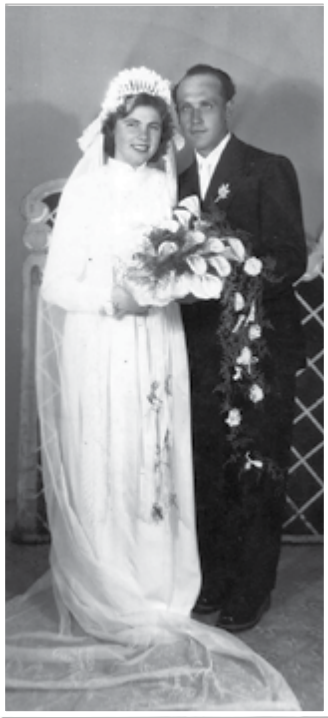
Az ifjú pár (1960. húsvét)