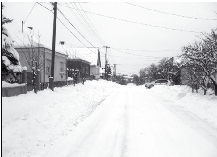
Téli arcát mutató Honvéd utca