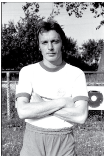
Jóska a focista