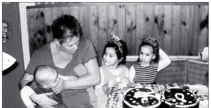
Mami és a gyerekek