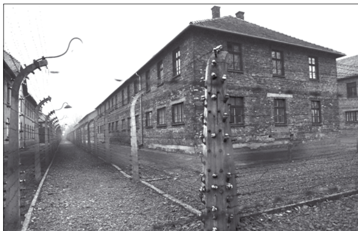
Az auschwitzi léger

dött a halálgyár, amelyre soha nem volt példa az emberiség történelmében. Gyerekek és idősök, nők és férfiak – 1,1 millió ember, akik közül a becslések szerint 1 millió volt zsidó – nagyipari elpusztítása, a lehető leggyorsabban és leghatékonyabban történt. Auschwitzban a léger felszabadítása után – minden más egyéb összehalmozott személyes holmi mel-