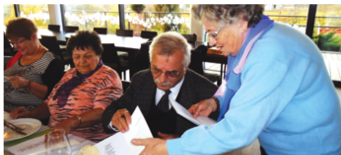
Czeidli István dedikál