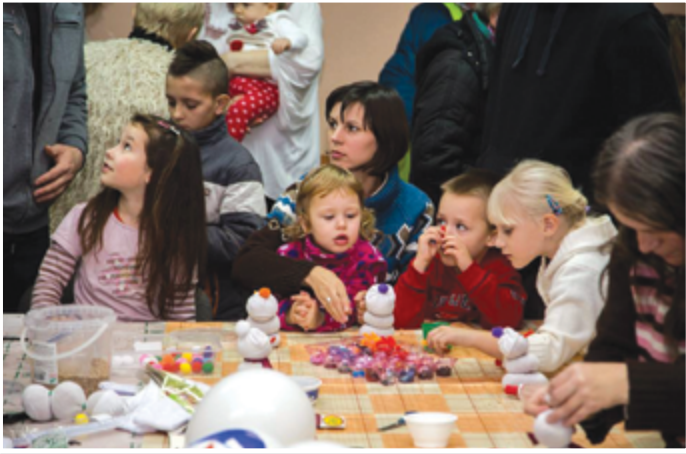
Készülnek a hóemberek