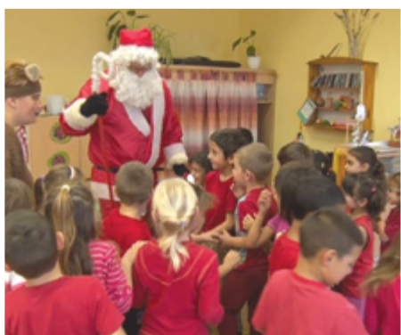
A Vackor Óvodába az óvónénik mikulásváró műsorát követően minden csoportba betért, és rengeteg új játékkal lepte meg az apróságokat.