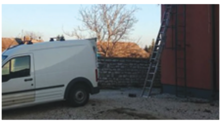
Újabb kamera került felhelyezésre a Devecseri Belvárosi Piac- és Rendezvénytéren.