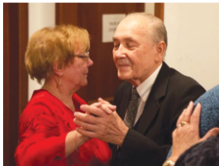
Zenés est keretében találkoztak ismét a városunkban működő nyugdíjas klubok a Makovecz lakóparkban, hogy teret adva a jókedvnek, megosszák egymás között értékes gondolataikat.