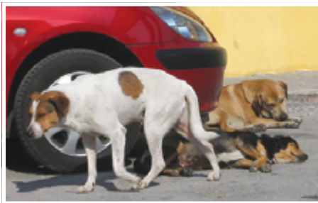
Gyepmester Devecserben Tisztelt Lakosság!