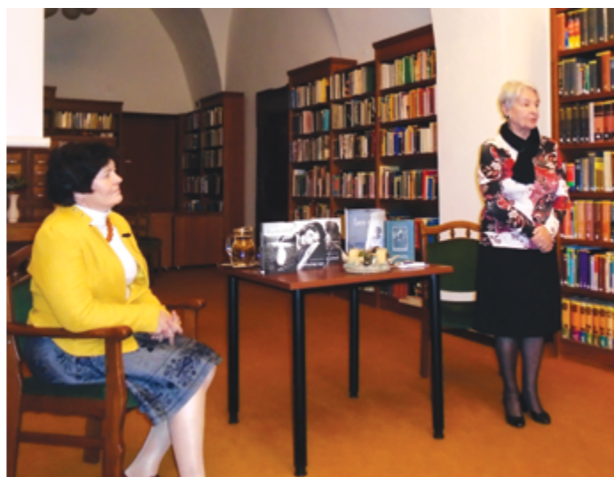
Az író-nő előadása az olvasóteremben