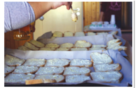
Idén is megrendezték a szlovén ötlet alapján indított Európai Mézes Reggeli programsorozatot, melynek célja a méhek és az egészséges életmód népszerűsítése, a helyben termelt élelmiszerek megismertetése. A programhoz az idei évben is csatlakoztak az általános iskola tanulói.