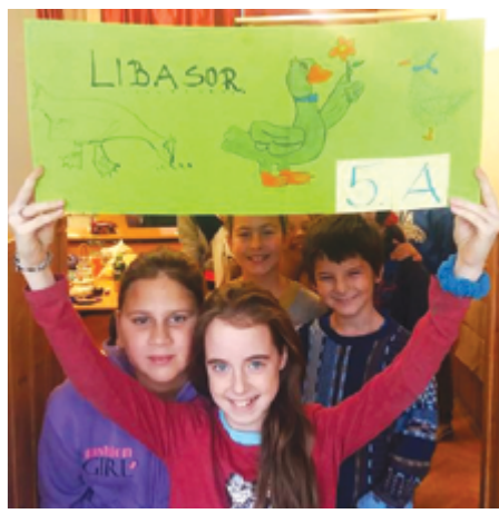
Márton napját, az általános iskola diákjai is megünnepelték. Ennek kapcsán, a tanórákon is a témakörhöz kapcsolódó feladatokat oldhattak meg. Nem maradhatott el a zsíros kenyér party formájában megtartott „libalakoma” sem, hiszen aki Márton napon libát nem eszik, az egész évben éheznek.