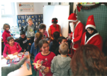
A Roma Nemzetiségi Önkormányzat segítségével több oktatási intézményt látogatott meg, hogy minden gyermeket megajándékozzon.