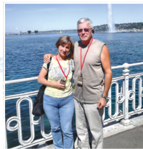
Nyugdíjban (a Genfi tónál)