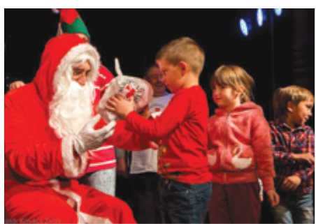
A Vöröskereszt jóvoltából eljutott a Művelődési Házba, ahol az Adrenalin együttes zenés, vidám műsorát követően több mint 1000 óvodás és alsó tagozatos gyermek számára okozott boldog perceket.