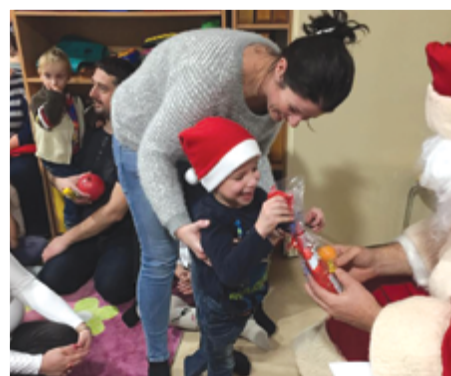
A Fanni Házba a közös éneklés, és a bábjáték hangjai vezették, hogy meglepetést hozzon a rá váró gyermekek számára.