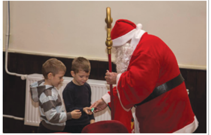
Találkozás a Télapóval