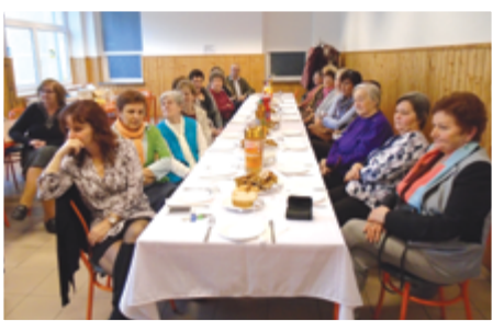
Az általános iskola pedagógus szakszervezete nyugdíjas szakszervezeti dolgozóit karácsony előtti hagyományos ünnepség keretében látta vendégül, ahol a zenés, verses műsort követően kívántak egymásnak békés ünnepeket.