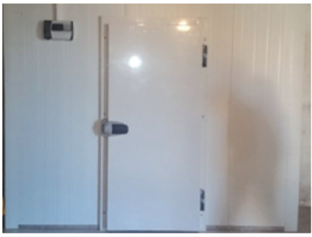
Elkészült a város első hűtőkamrája, mely a Start-munkaprogramban megtermelt zöldségek és gyümölcsök tárolását szolgálja majd.