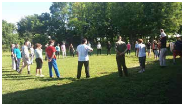
Rege és Kisrege Táncgyűttesek táncműhelye