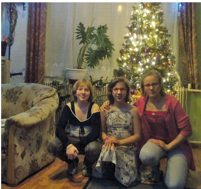
Otthon: koncert után karácsonykor