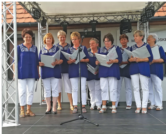
Somlós-vásárhelyi Líra Dalkör