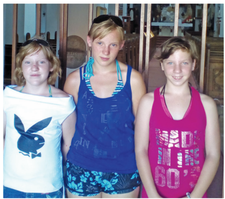
Badacsony 2017 nyara