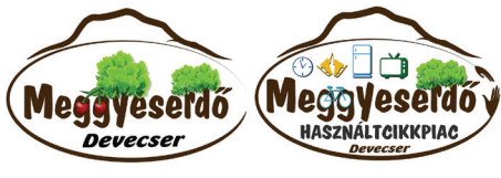
Elkészült a Meggyeserdő és a Devecseri Használtcikkpiac logója.