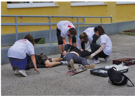
Az idei évben ismét a devecseri általános iskola adott helyet a Magyar Vöröskereszt által szervezett megyei elsősegélynyújtó versenynek. A továbbjutó csapat az országos döntőn képviseli Veszprém megyét, mely Kaposváron kerül megrendezésre.