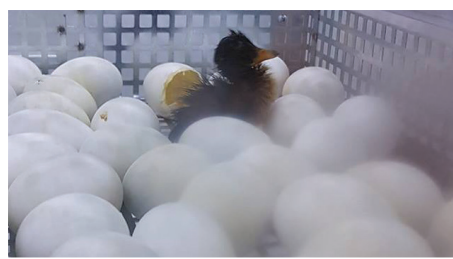
A devecseri Start munkaprogram keretében, a sikeres keltetés eredményeképpen megszülettek az első kacsák.