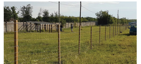
A meggyeserdei egykori sportpályán - a megfelelő tartási körülmények biztosítása érdekében - lekerített legelőt és a beállított alakították ki a Start munkaprogram kecske- és juhállományának.