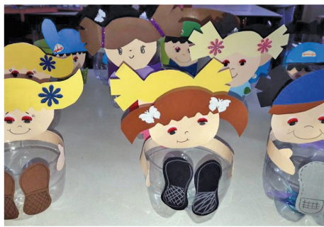
Újrahasznosítás: Pet-palackból cukorkatartó