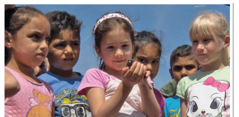
A Magyar Madártani és Természetvédelmi Egyesület Veszprém Megyei Helyi Csoportja és Devecser Város Önkormányzata szervezésében idén is megrendezésre került a madárgyűrzési bemutató és állatsimogató.