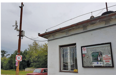
Megkezdtek az új kamerarendszer kiépítését a Meggyeserdőn.