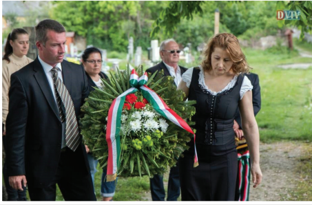
A Vörös terror áldozataira emlékeztek 2017. május 12-én.