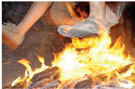
Szent Iván éji tűzugrás

Június 8-a Medárd napja, az egyik legismertebb időjóslo dátum. Úgy vélik, ha Medárd napján esik, akkor negyven napig meg sem áll, ha pedig nem esik, akkor negyven napos szárazság következik. Június 10-én Medárd után Margit lephet meg bennünket. "Margit felhőtől fél, égi háborút vél" - mondogatták eleink arra utalva, hogy a zivatar elveri a gabonát és leveri a gyümölcsöt a fáról. Szintén jósló nap 11-én Barnabás napja, amikor „Ha szép az idő, tele lesz a magtár, ám az eső csak pusztítja a szőlőt. Június 24. Szent Iván napja. Ekkor van az év legrövidebb éjszakája, mely a hiedelem szerint a varázslatoknak is kedvez, főként a szerelemben és a bőségben. A Szent Iván napi tűzugrásnak is egészség- és szerelemvarázsló célja van. A tűz átugrása közben párosító-, kiházasító dalokat énekelnek, melyek gyakran igen hosszúra sikerülnek, erre utal a közismert szólás: „Hosszú, mint a szentiváni ének”. A néphit szerint, aki Szent Iván napján pillangót fog, egész évben szerencsés lesz.