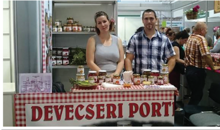
A Pápai Agráréxpon is bemutatkozott városunk hivatalos termékcsaládja, a Devecseri Portéka.